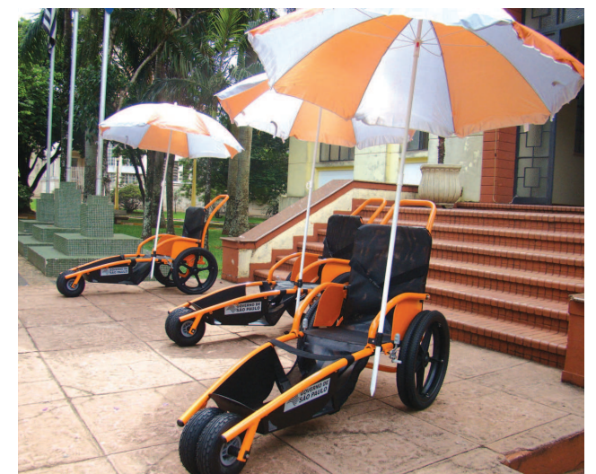
Três das dez cadeiras anfíbias já chegaram em Avaré

Na última quinta-feira, 19, a equipe da EMEB “Maneco Dionísio”, através de seus alunos, realizou apresentações de músicas, textos, poesias em comemoração a diversas datas do mês de abril, sendo elas o Descobrimento do Brasil, Tiradentes, Dia do Livro e Dia do Índio. Página 8.