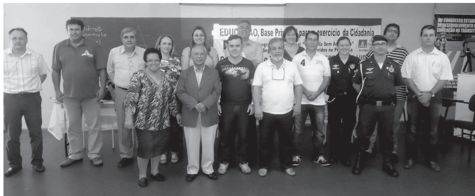
Participantes do encontro do G8 em Marília

No último dia 12 de abril, na cidade de Marília, foi realizado no recinto da Fundação Eurípedes – UNIVEM, Campus Universitário, o encontro do G8. Neste encontro, estiveram presentes e compoem a mesa diretora representantes das oito cidades que compõem o grupo, sendo elas Avaré, Santa Cruz, Botucatu, Ilha Solteira, Marília, Lençóis Paulista, Bauru e Ribeirão Preto, as mais assíduas nos Congressos realizados anualmente em Marília.