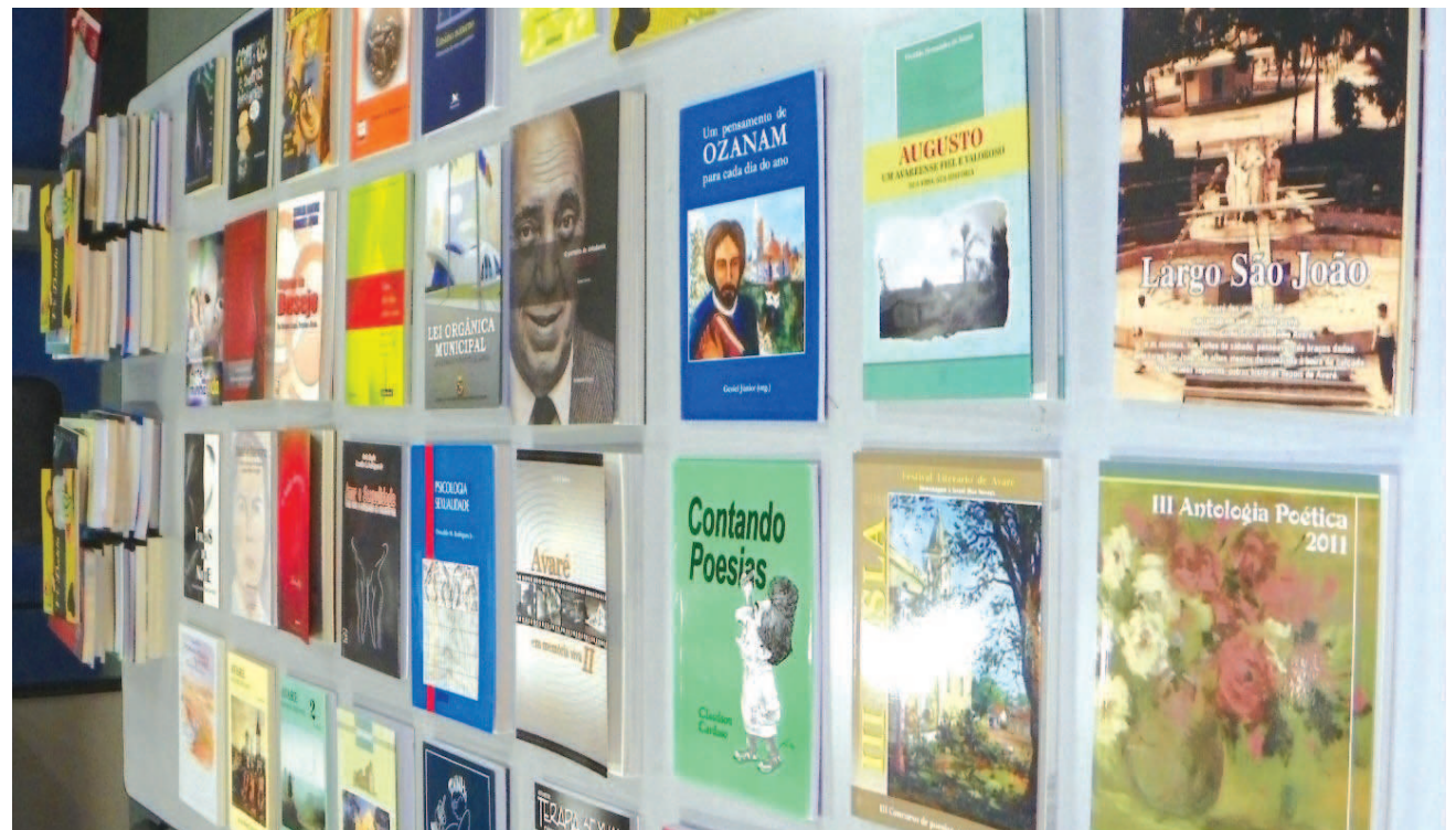
Autores de Avaré valorizaram a Semana do Livro doando suas obras