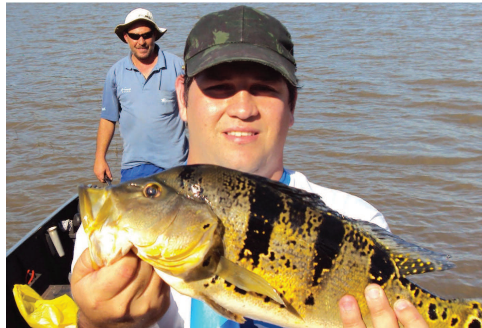
Tucunaré pescado durante uma das edições do torneio

Serviço - As inscrições para o torneio podem ser feitas nas lojas Bom da Pesca e Miltinho Pesca e Rações. São R$ 30,00 por embarcação de três pessoas, mais 3 quilos de alimentos não perecíveis.