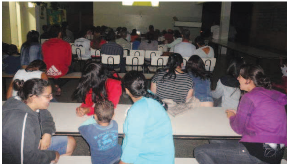
Crianças da Barra Grande assistem as produções avareenses