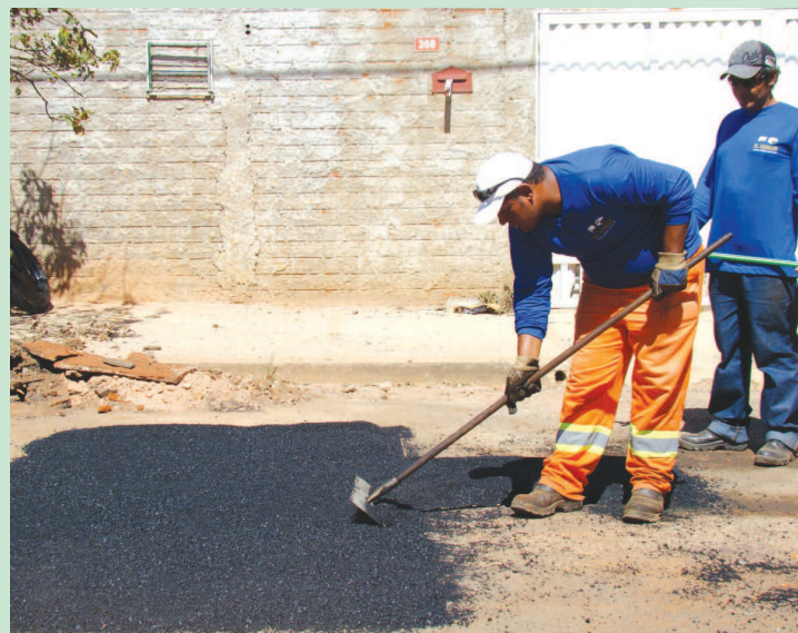
Funcionários executando os serviços em uma das ruas do Bairro Santa Mônica

Nesta semana os trabalhos da Operação “Tapa Buracos” estão sendo executados no Bairro Santa Mônica, onde já passou pelas ruas Wenceslau Carlos Belinato, Cabo Domingos Barreira Sobrinho, Oscar Gonçalves, Arlindo Almeida e está em fase final da Rua João Cruz.