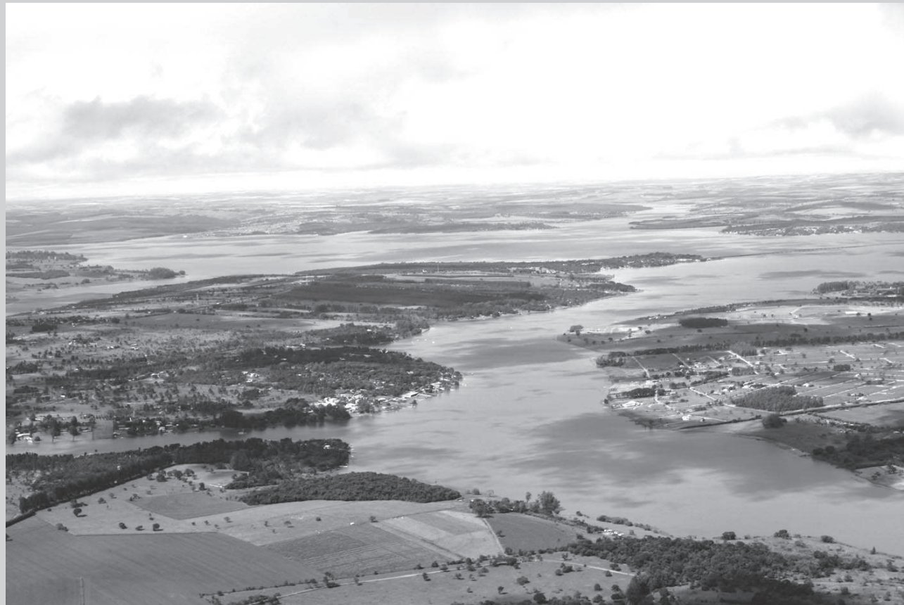
Panorâmica da Represa de Jurumirim: mar de água doce

No seu diário “Uma Trajetória Ambientalista”, o ex-secretário especial do Meio Ambiente, Paulo Nogueira Neto, revela os bastidores do caso Braskraft. Ele desempenhou essa função ligada ao antigo Ministério do Interior, com prerrogativas de ministro, de 1974 a 1985, nos governos Geisel e Figueiredo.