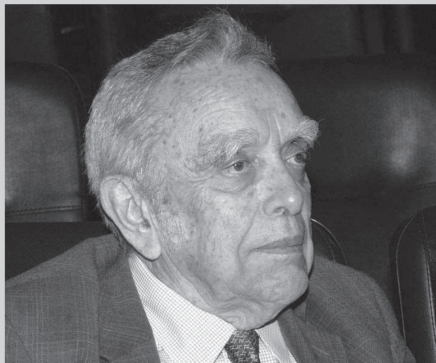
Paulo Nogueira Neto, célebre ambientalista

Em março de 1979, os diretores da Braskraft resolveram mudar seus planos para o Paraná, onde viam melhores condições ambientais. Por fim, a luta, felizmente, obteve resultado satisfatório e, em agosto do mesmo ano, o governador Paulo Maluf sancionou lei proibindo a instalação de fábricas poluentes às margens do Paranapanema, “patrimônio natural que pertence à história e ao futuro da nação”. ■