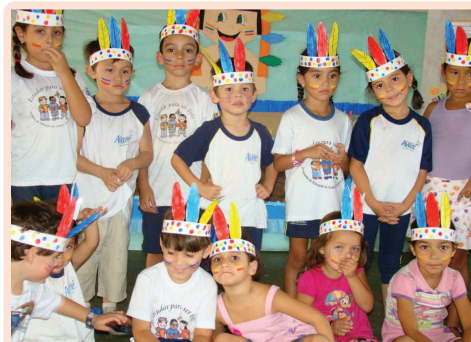
Alunos da escola caracterizados de índio