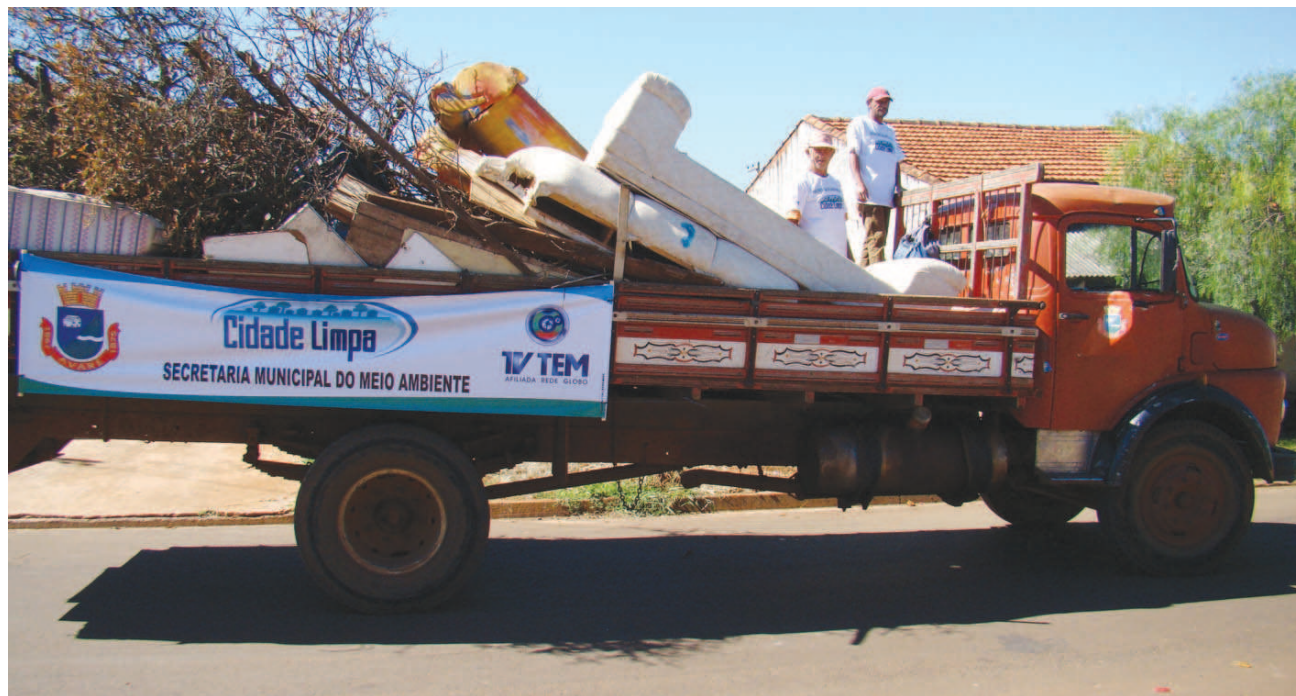
Caminhão da prefeitura recolhendo entulhos

Em 10 anos, já foram recolhidos o equivalente a mais de 150 mil caminhões carregados de lixo. O material coletado vai para um ponto de apoio e, depois, para a reciclagem.