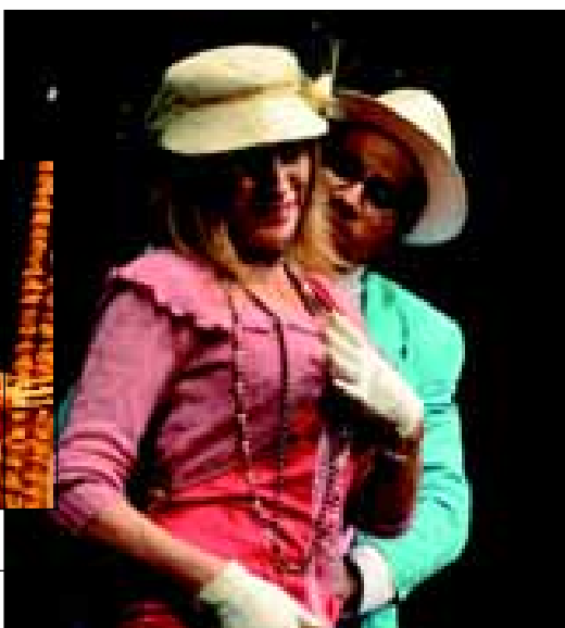
“O Bem Amado”