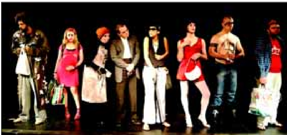
“Mauá Pirituba – O Expresso das Contradições”

Caetano do Sul, entre outras. Todas as apresentações acontecem a partir das 20h30.