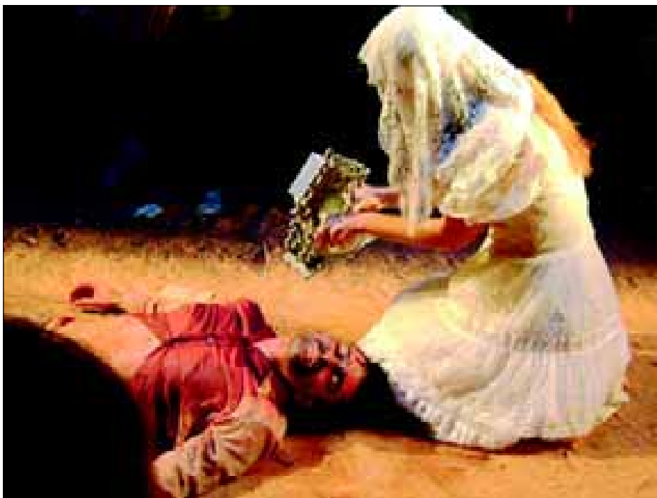
Peça “Folia do Homem Diabo”

O IV FESESTE acontece no Teatro “Dr. Octávio Morales Moreno”, na Rua Rio Grande do Sul nº 1775, com entrada franca, porém, os ingressos devem ser retirados antecipadamente no local de realização do evento. Serão 9 peças, todas premiadas, sendo 7 concorrentes e 2 convidadas, de cidades como Pindamonhangaba, Jaú, Presidente Prudente, São Paulo, Marília, Santos, São