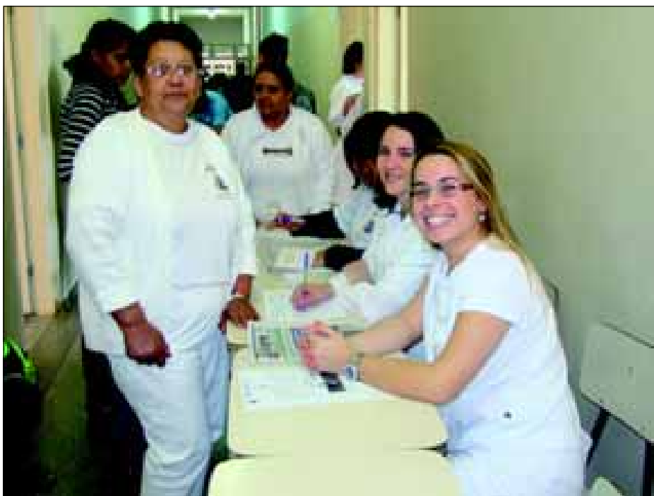
Atendimento na área da saúde

O Projeto de Ação Social “Prefeitura no Bairro”, realizado no último dia 31 de julho, no EMEB “Professora Maria Nazaré Abs Pimentel”, no Bairro Camargo, atendeu 3.428 moradores, 76,17% da população estimada do bairro.