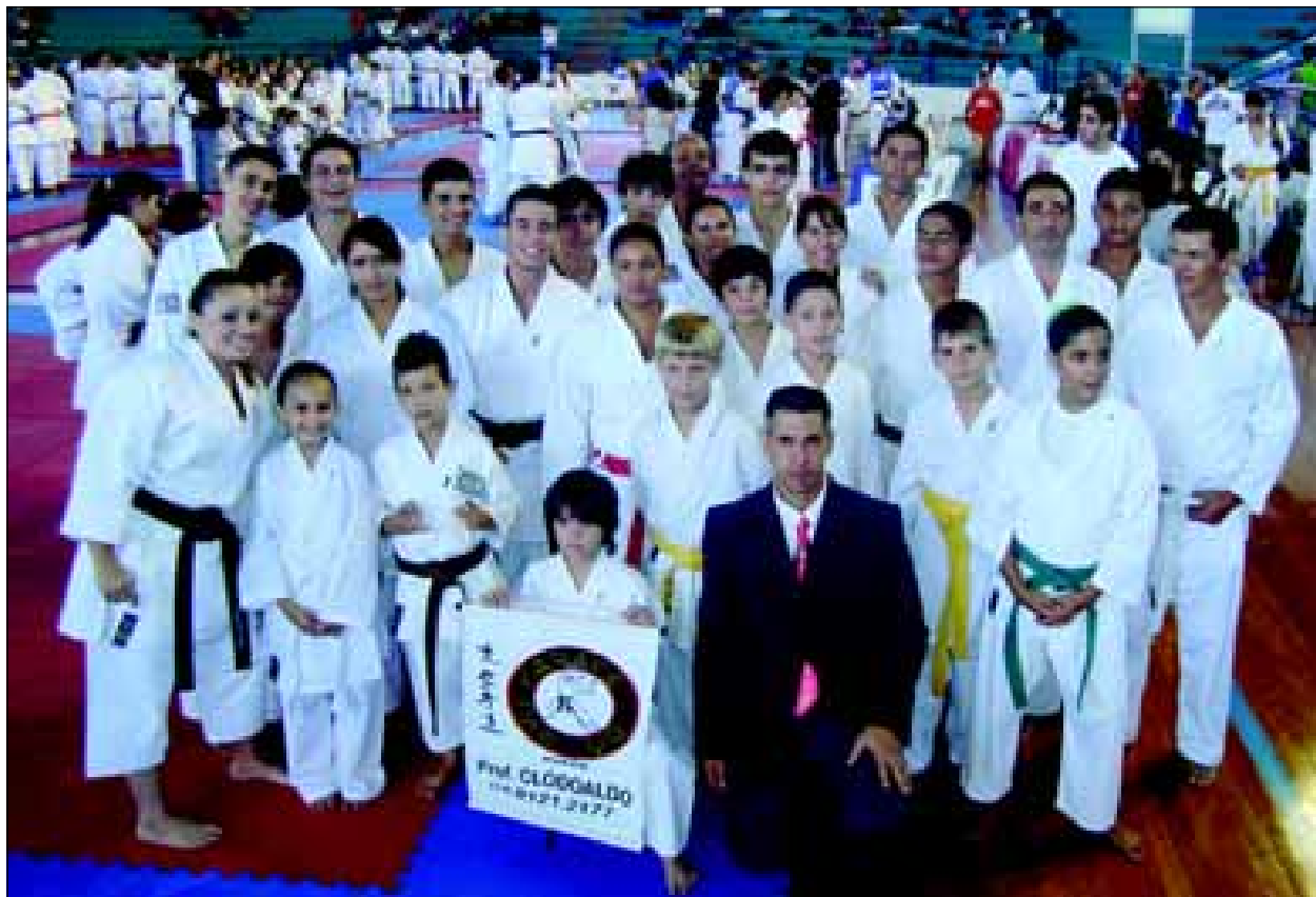
Equipe avaréense de Karatê Interestilos

Deverão participar do evento cerca de 400 atletas, com idades entre 5 a 60 anos, campeões mundiais, campeões paulista, brasileiro e outros.