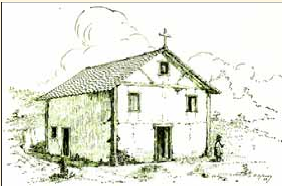
Capela do Major: primeira igreja paroquial de Avaré