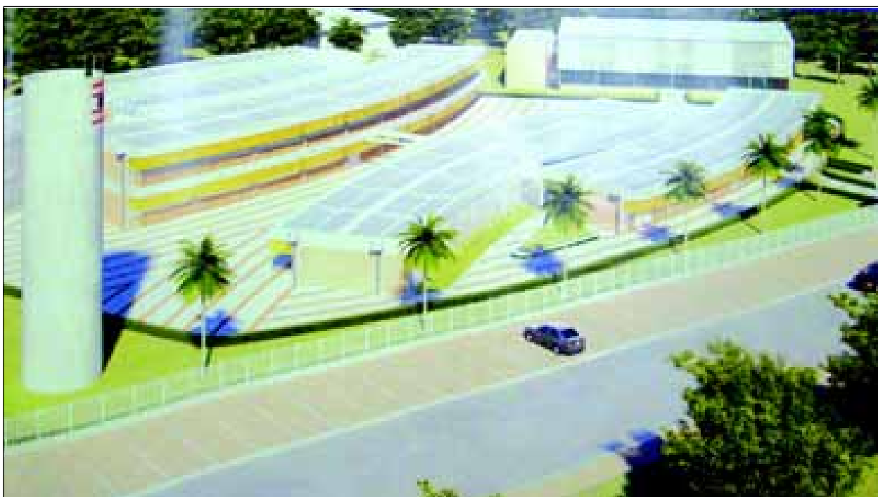
Maquete eletrônica da nova escola do Sesi