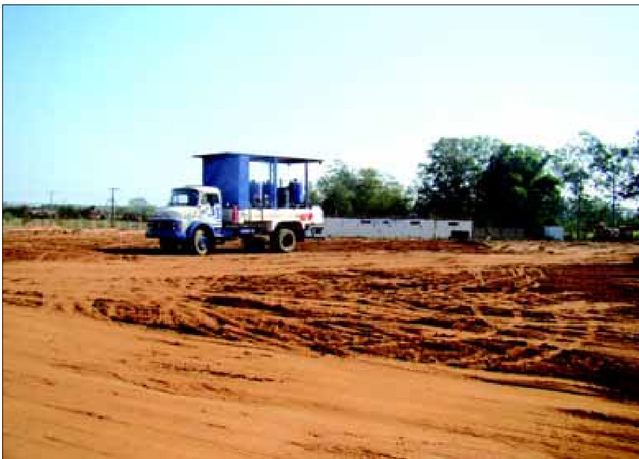
Preparação do terreno para a construção da futura escola do Sesi

Importante frisar, que o volume de recursos previstos para instalação da unidade, foi o maior conhecido nos últimos anos. Dos 30 mil metros quadrados adquiridos, 21 mil metros foram permutados e 9 mil metros foram comprados.