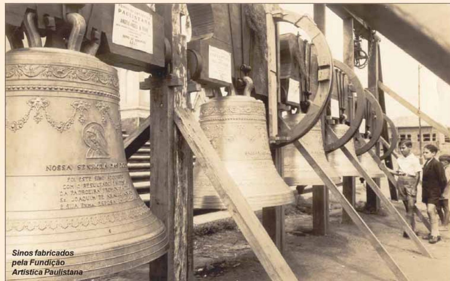
Sinos fabricados pela Fundição Artística Paulistana

Feitos de bronze numa liga de quatro partes incluindo cobre e estanho mais uma dosagem de ouro, prata e outros componentes para otimizar sua sonoridade, os sinos conservam fórmulas secretas em sua fabricação, transmitidas entre gerações pelas famílias construtoras, quase sempre italianas, alemãs ou portuguesas.