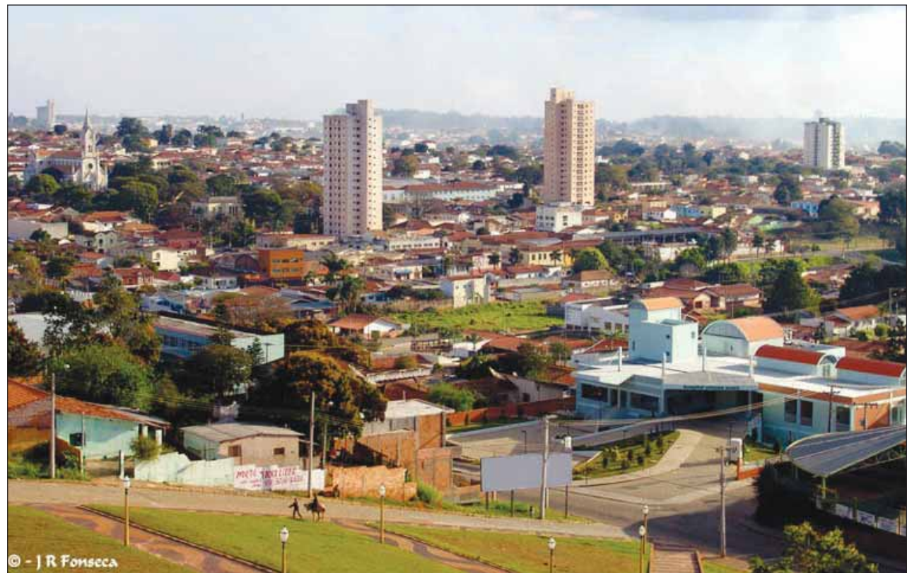
Investimentos geram aumento nas vendas

A crise financeira que assombra a Prefeitura não foi maior que o planejamento da equipe econômica que soube driblar os obstáculos e economizar para que em dezembro pudesse ser pago regularmente o salário e o décimo terceiro dos servidores da prefeitura.