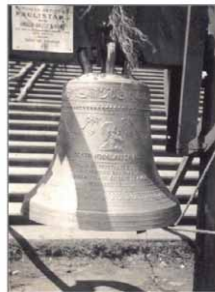
Sino Beato Nicolau de Flüe, doação de Theodor Bannwart

um caminhão. Fui guiando o nosso Ford 36 até São Paulo. O trajeto foi feito todo por terra, numa viagem que levou quase 20 horas, entre ida e volta. Chegamos em Avaré, empoeirados, e descarregamos, durante a noite, quase três toneladas, o peso total dos novos sinos, que ficaram expostos por algum tempo na praça da Matriz".