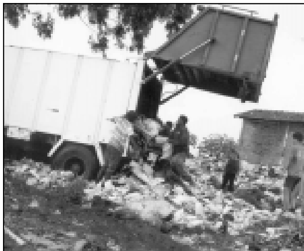
Várias pessoas sobrevivem do lixo que conseguem no Lixão