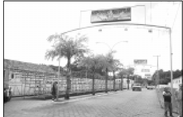
Avenida Major Rangel já está preparada para o Carnaval

No Camping Municipal a folia já começa na sexta-feira (dia 4) e vai até a terça-feira de Carnaval. No local, às margens da Represa, haverá palco com som, iluminação e aulas de aeróbica. Para receber o grande número de turistas e avareenses que deverão comparecer no Camping nestes dias, a Prefeitura providenciou a reforma completa do local. Esta reforma só foi possível graças a parceria com a empresa Miner, que está custeando as obras. Para o Carnaval o Camping con-