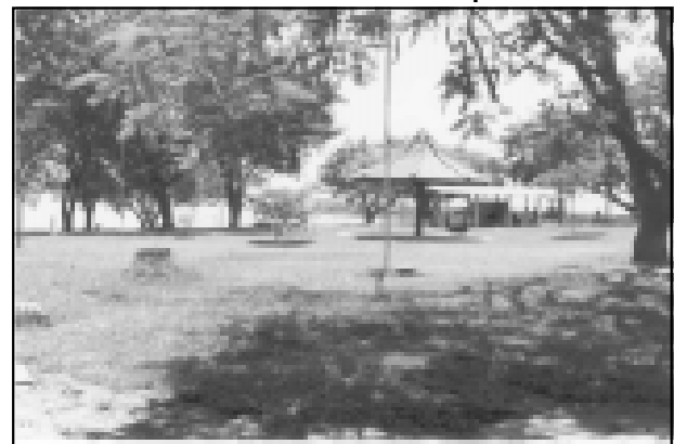
Camping está sendo preparado para o Carnaval

tará com os banheiros reformados e pintados, churrasqueiras com iluminação além das demais melhorias que o local estava necessitando. É