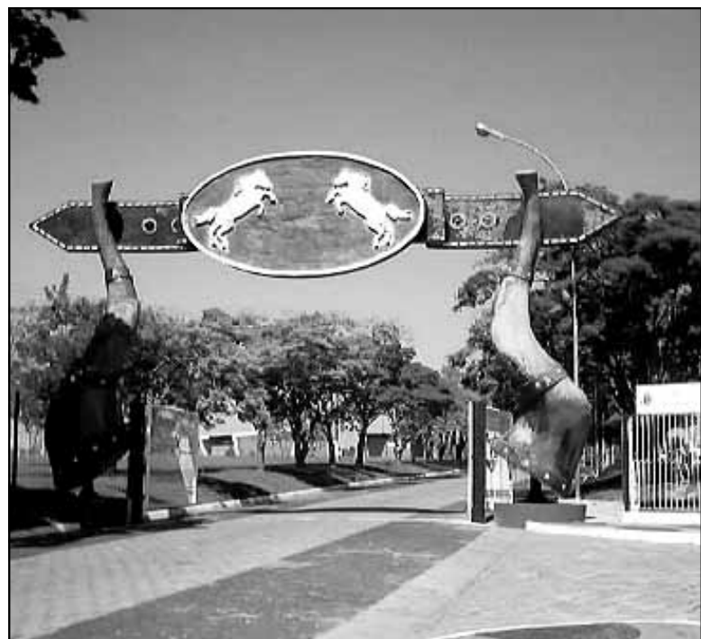
Parque de Exposições vem recebendo melhorias

A Exposição Municipal Agropecuária de Avaré, a Emapa, poderá ter um patrocinador forte para este ano. A festa que é realizada em dezembro tem tudo para ser ainda mais grandiosa neste ano com o novo patrocinador. A intenção é de que com um bom patrocínio não haja a necessidade de se investir dinheiro público no evento