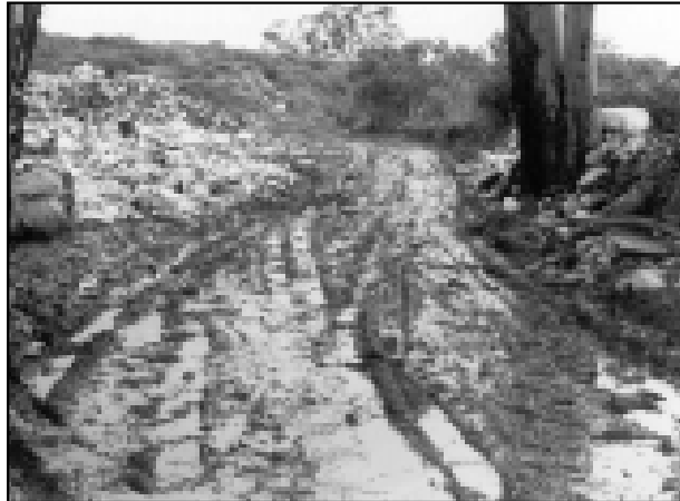
Chorume escorre a céu aberto no Lixão

Dentro de alguns dias a Prefeitura cumprirá as exigências da Cetesb e o Lixão deverá ser fechado. A intenção é resolver junto a Cetesb os problemas das multas que chegam a quase R$ 10 milhões.