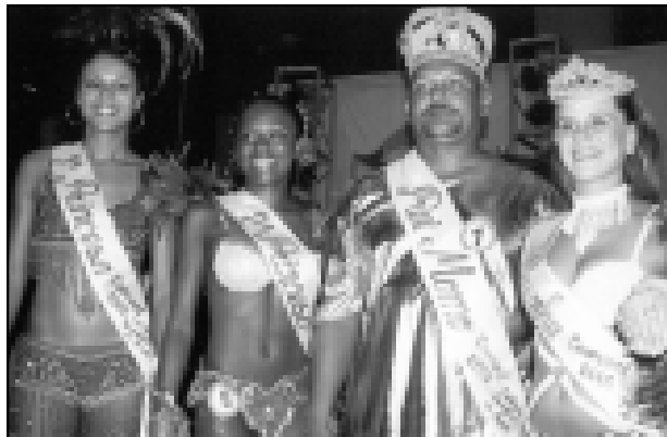
Rainha, Rei Momo e Princesas do Carnaval de Avaré

A organização do evento convidou sete jurados que tiveram muito trabalho para es-