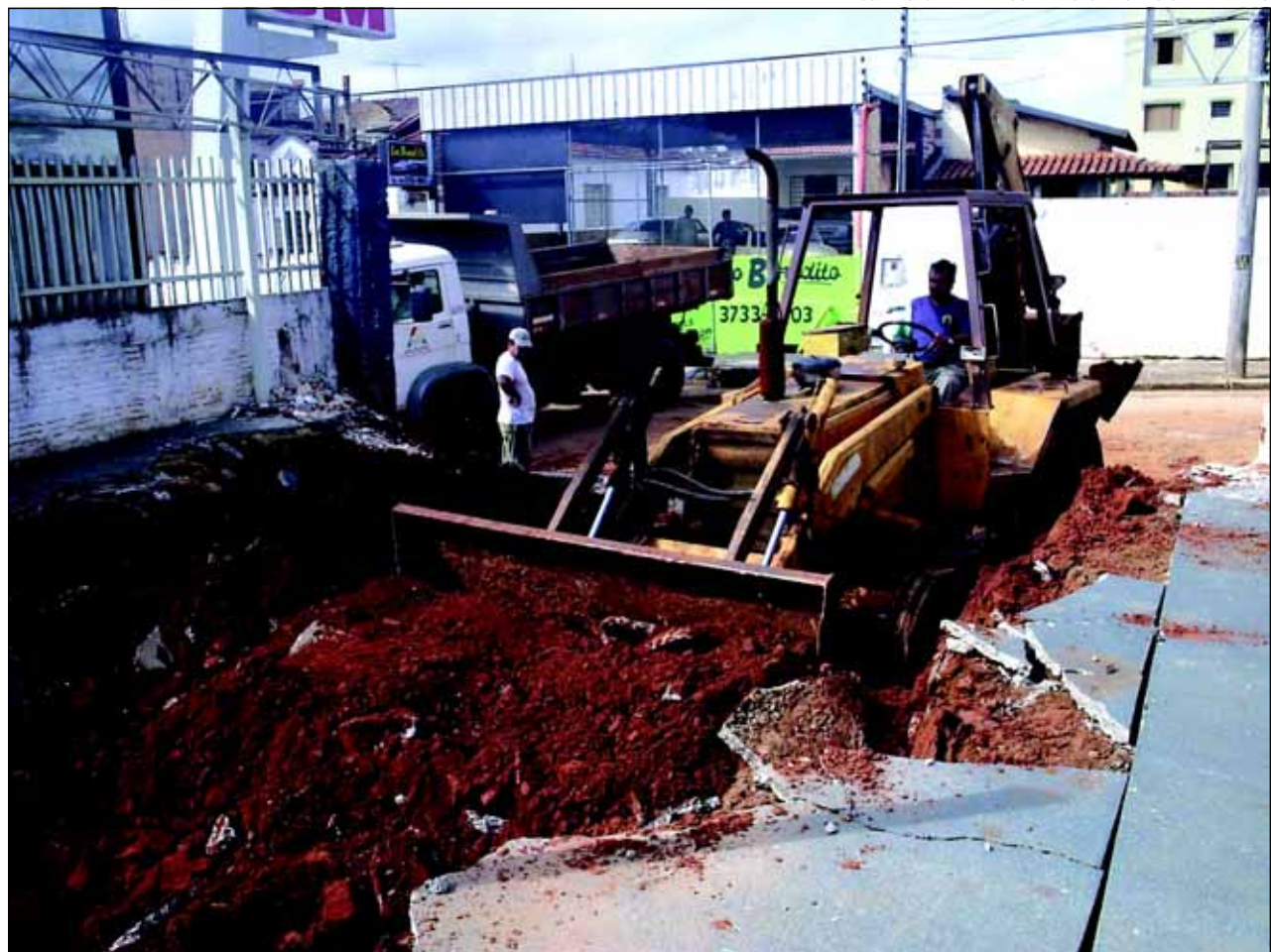
Maquinários da prefeitura em trabalho de escavação

mentos das Ruas Distrito Federal, Rio Grande do Norte e Voluntários de Avaré com Rua Maranhão tem se transformado em verdadeiros pisciões de contenção de águas de chuvas, que em média demoram mais de meia hora para finalizar a vazão, consequência do estrangulamento do antigo canal, motivo pelo qual com a construção de um canal a céu aberto no antigo leito do córrego naquelas imediações trará uma solução definitiva aos problemas de inundação, dentro de um custo relativamente muito mais inferior do que uma galeria de concreto armado, sob o leito carroçável das ruas locais.