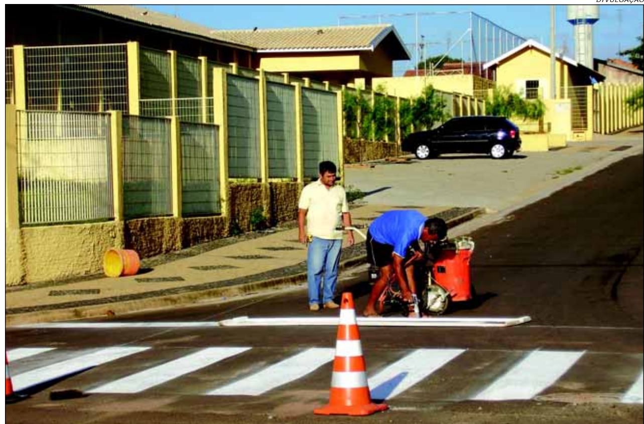
Sinalização Viária junto as escolas - questão de maior segurança aos alunos

No momento os trabalhos estão sendo realizados na Escola Municipal Professor Ulysses Silvestre no Jardim Vera Cruz.