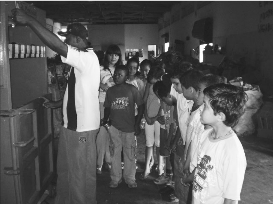
O objetivo é de conscientizar as crianças que mudanças de hábitos e comportamentos levam a uma vida saudável com qualidade