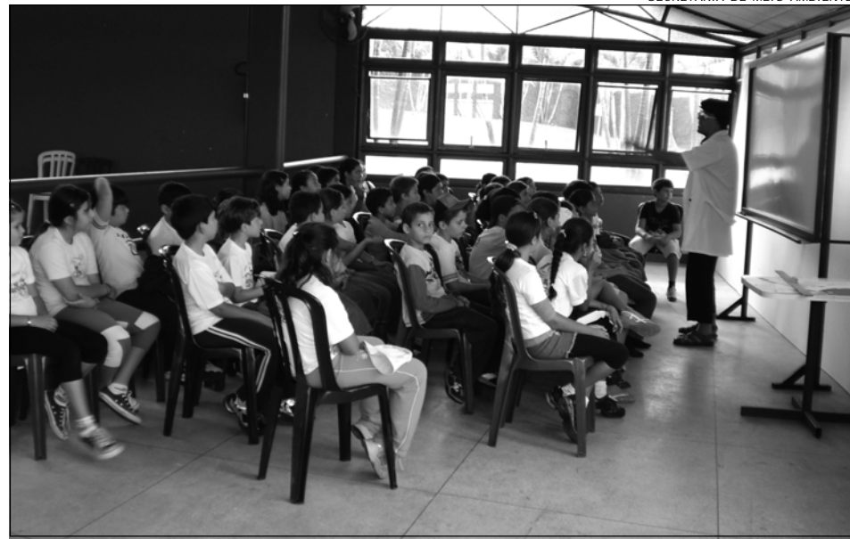
Evento envolveu mais de 600 alunos de 3ª à 5ª série da rede de ensino municipal e estadual

O evento contou com a boa estrutura do local apropriado para todas as apresentações onde foi possível receber todos os alunos e desenvolver as atividades de forma organizada sem nenhum registro de ocorrência negativa pois seguindo as orientações dos funcionários da Sabesp, os moni-