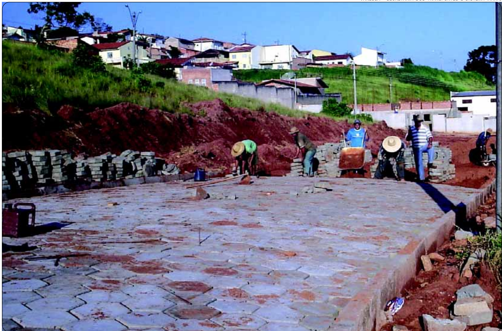
Avenida Nações Unidas já recebe a pavimentação em lajotas

A obra é uma reivindicação antiga da população e irá beneficiar um grande número de pessoas que trafegam pelo local.