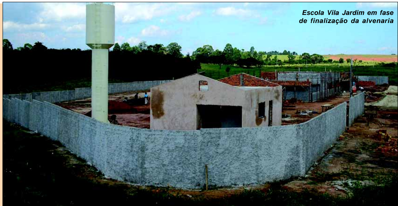
Escola Vila Jardim em fase de finalização da alvenaria

A Prefeitura da Estância Turística de Avaré, num objetivo levar a população da Vila Cidade Jardim melhorias no sistema de educação municipal, está