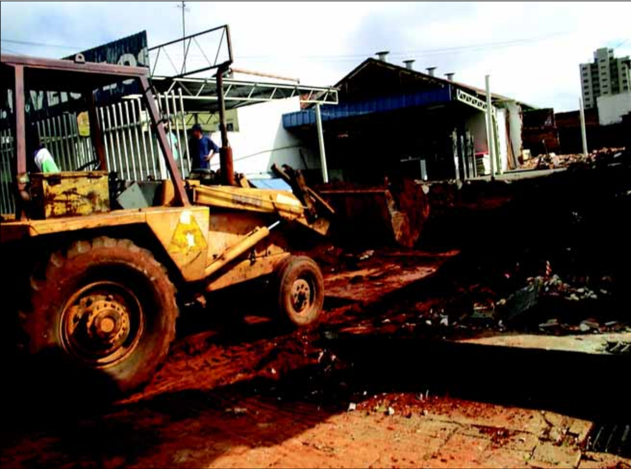
Obras de terraplenagem e escavações

SECRETARIA DOS TRANSPORTES E SISTEMA VIÁRIO