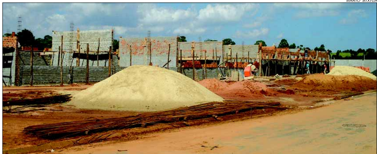
A nova escola atenderá todo o bairro da Vila Jardim e imediações

A Prefeitura da Estância Turística de Avaré, num objetivo levar a população da Vila Cidade Jardim melhorias no sistema de educação municipal, está constru-