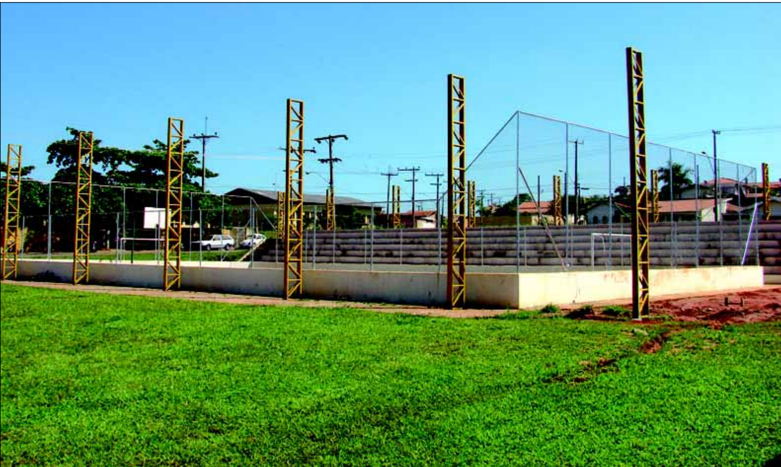
Em fase de elevação dos pilares para recebimento de estruturas metálicas

Dando seqüência no projeto de cobertura de quadras municipais poliesportivas, a Prefeitura da Estância Turística de Avaré iniciou as obras de implantação de cobertura em estrutura e telha metálica da quadra da escola Municipal Victor Lamparelli, no Bairro Alto, onde a referida construção terá uma área construída de 1.123,00 metros quadrados.