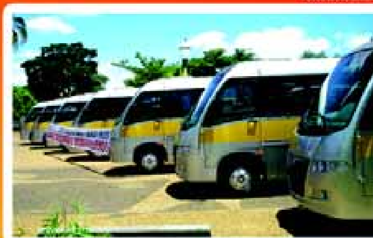
Ônibus novos fazem o transporte de alunos dentro da cidade