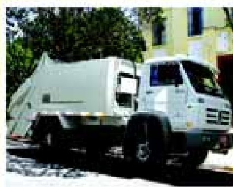
Veículo novo para a coleta de lixo