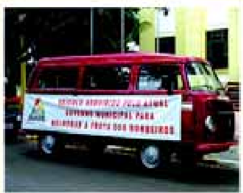
Prefeitura adquiriu veículo para o Corpo de Bombeiros