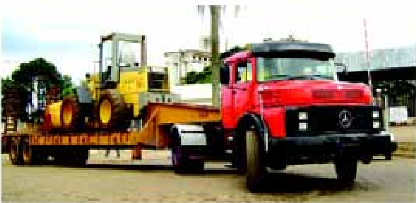
Caminhão que estava sucateado foi recuperado