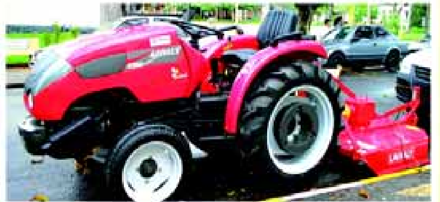
Trator para limpeza de praças e jardins