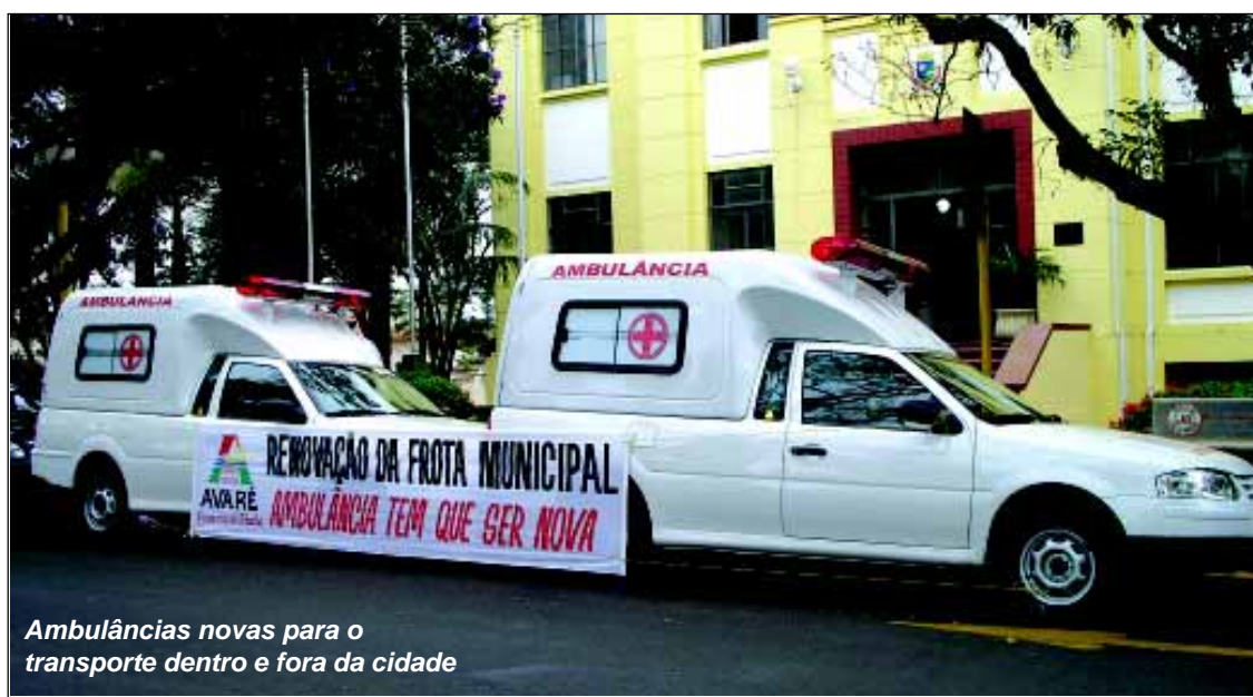
Ambulâncias novas para o transporte dentro e fora da cidade