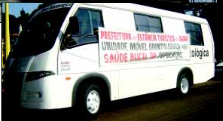
Micro-ônibus é uma unidade móvel odontológica