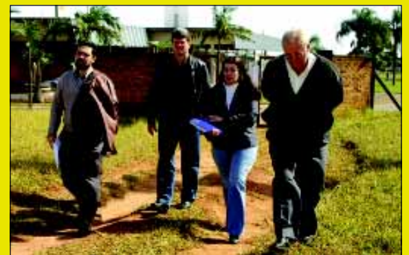
Técnicos foram acompanhados por funcionários municipais

Na última quarta-feira, dia 30 de maio, técnicos da CEFET (Centro Educacional Tecnológico) de São Paulo, estiveram em Avaré visitando a área oferecida para a cons-