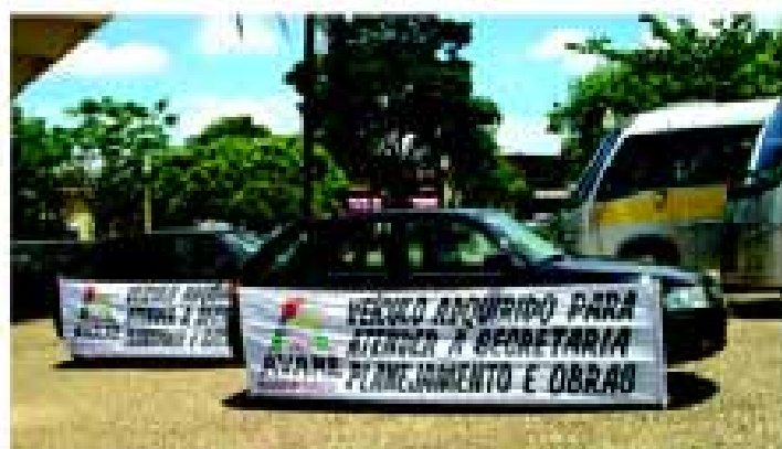
Secretarias de Obras e Transportes receberam novos veículos