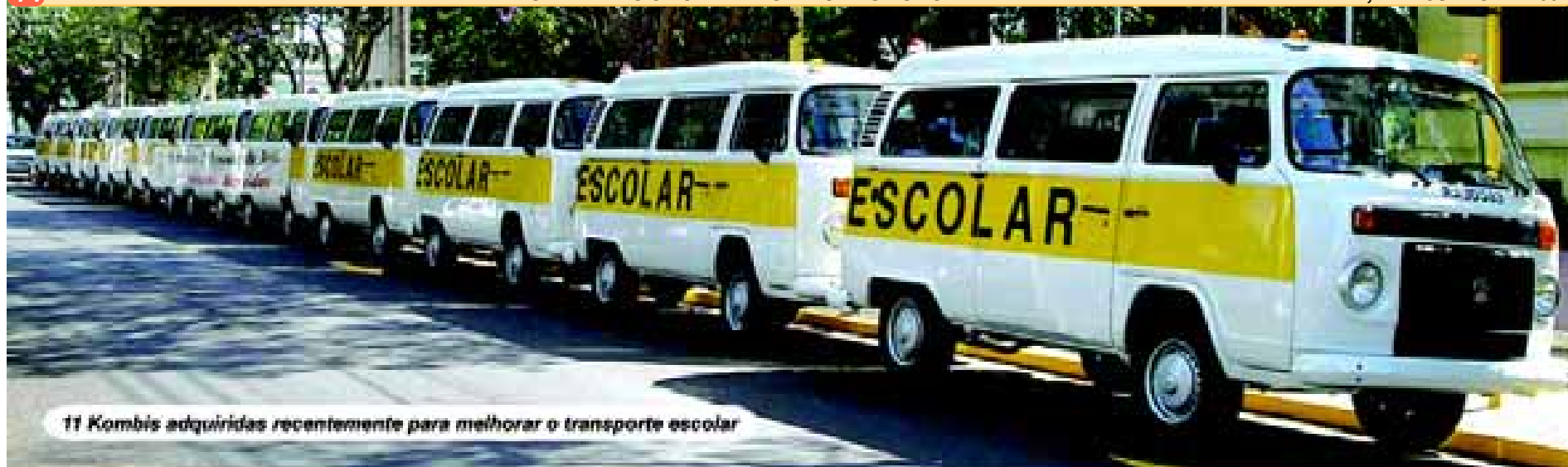
11 Kombis adquiridas recentemente para melhorar o transporte escolar