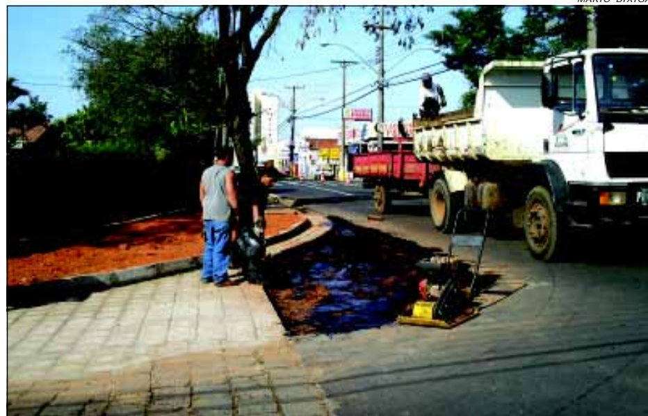
Benfeitoria melhorará visão dos motoristas