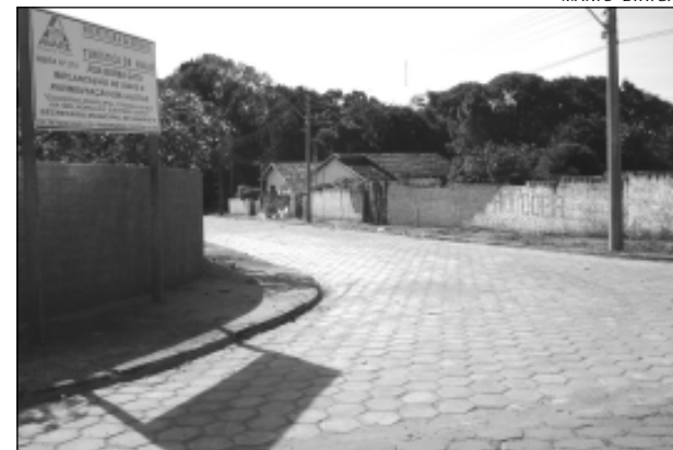
A pavimentação é uma reivindicação antiga dos moradores locais

A pavimentação é uma reivindicação antiga dos moradores locais, já que o loteamento existe desde 1976 e agora recebe a benfeitoria.