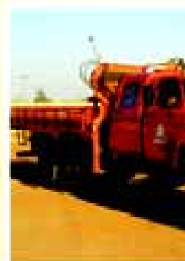
A Prefeitura recuperou outros