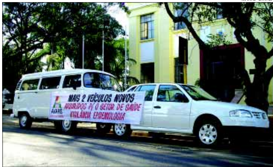
Veículos adquiridos para a Vigilância Epidemiológica