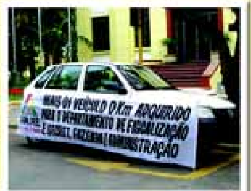
Veículo adquirido para o setor de Fiscalização