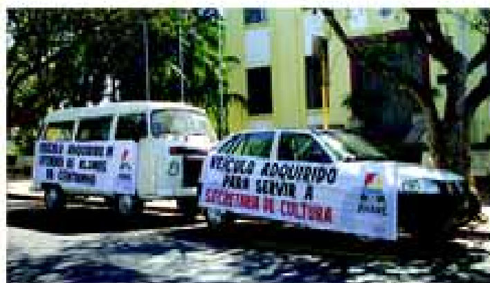
Educação e Cultura receberam novos veículos

A Prefeitura da Estância Turística de Avaré está realizando uma importante renovação na frota de veículos municipal. Nos últimos anos, é a segunda vez que isso ocorre. No período de 1997 a 2000 já houve uma renovação completa nos veículos da Prefeitura. A partir de 2005 se percebeu a necessidade desta segunda renovação, pois grande parte dos veículos estava sucateada.