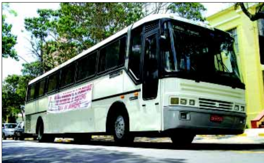
Ônibus para o transporte de pacientes para outras cidades