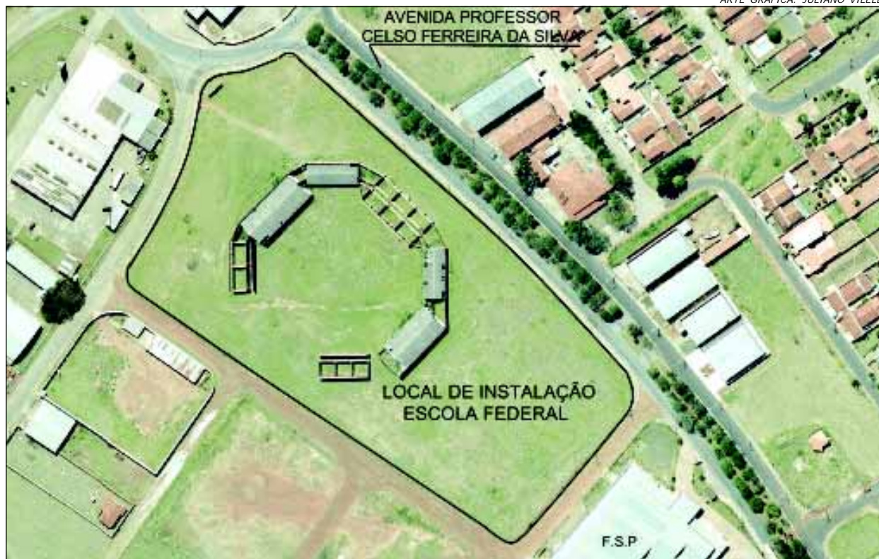
Local onde será construída a Escola Técnica Federal