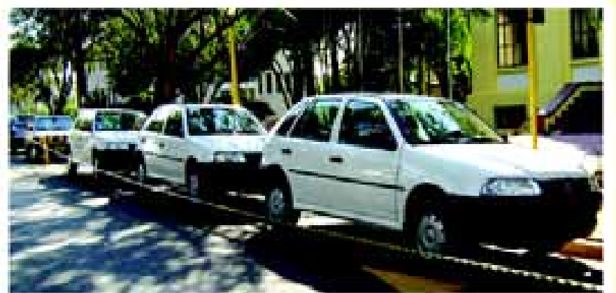
Veículos adquiridos para diversas secretarias