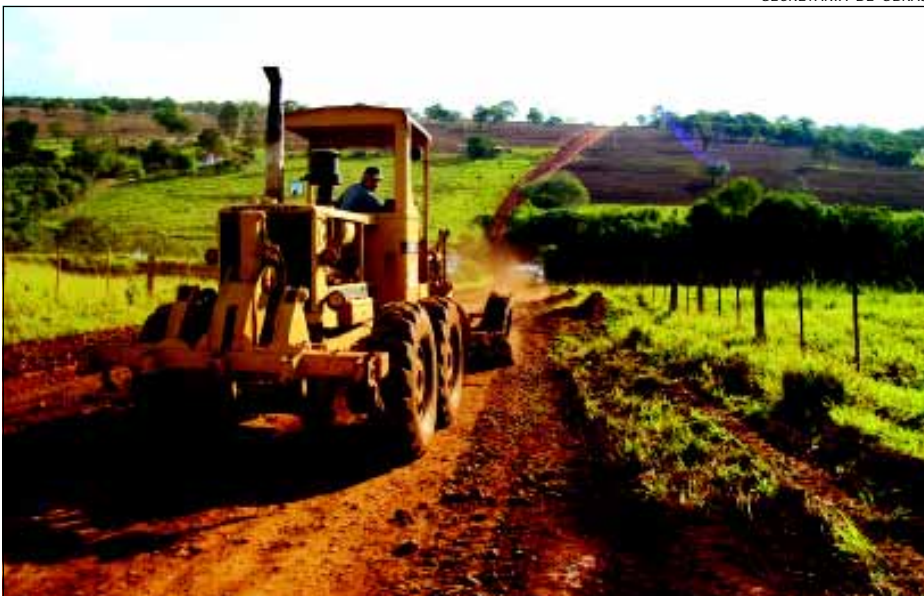
Melhorias nas estradas rurais beneficiam o transporte da produção agrícola

A Prefeitura da Estância Turística de Avaré está realizando o trabalho de recuperação nas estradas rurais do município. Recentemente o trabalho já foi encerrado nas estradas do Andrade e Silva, Barra Grande, Itatinga e Aracatu. Atualmente os trabalhos estão concentrados nas estradas da Pedra Preta, Cutrale e Coqueiros.