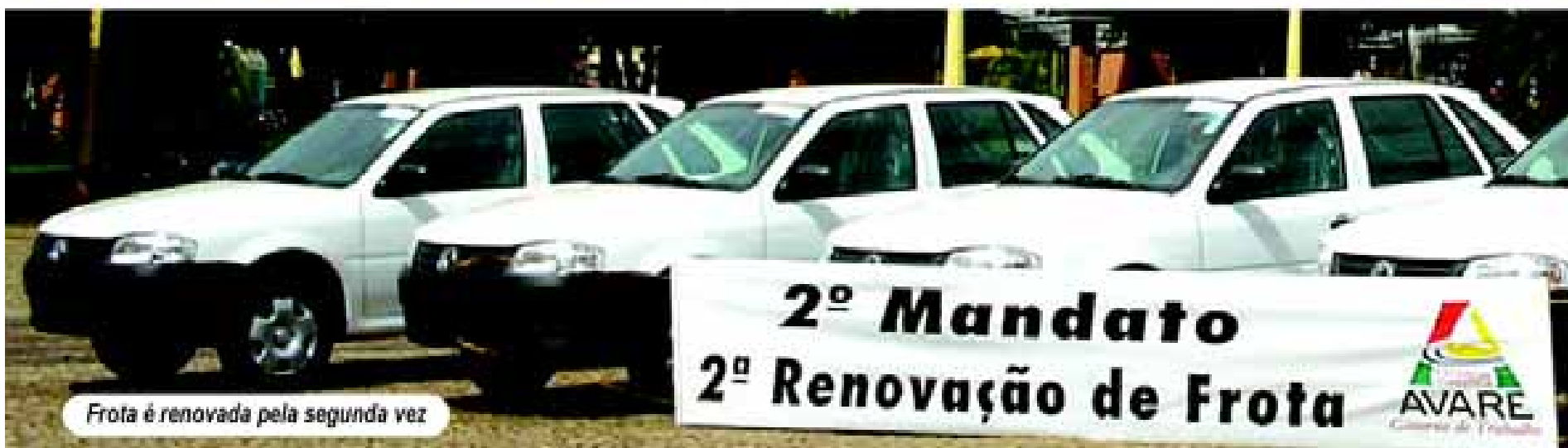
Frota é renovada pela segunda vez

Com a renovação completa da frota municipal a Prefeitura pretende proporcionar mais conforto e segurança para toda população que utiliza os serviços da Prefeitura. Confira a relação completa dos veículos na página 15.