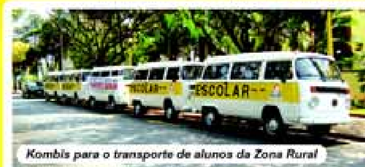
Kombis para o transporte de alunos da Zona Rural