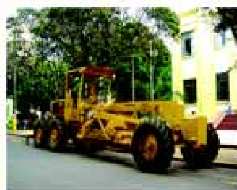
Máquina Patrol para recuperação das estradas rurais