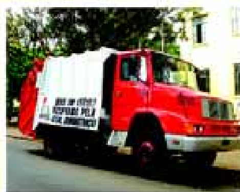
Caminhão da coleta de lixo recuperado pela Prefeitura