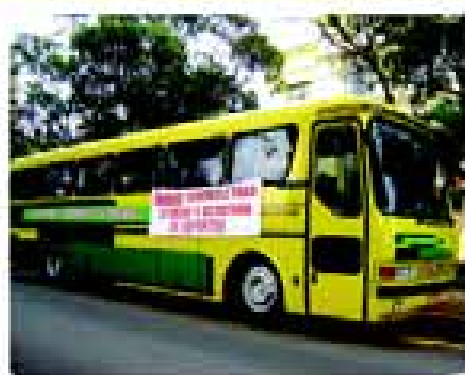
Ônibus para o transporte das equipes esportivas