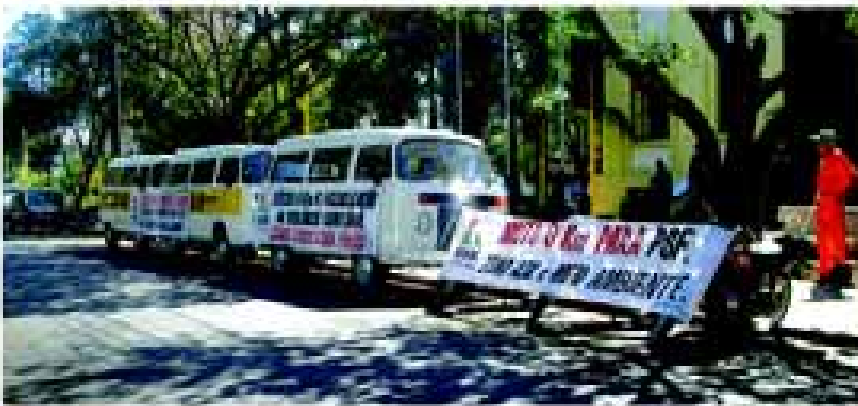
Motos agilizam o trabalho em alguns setores