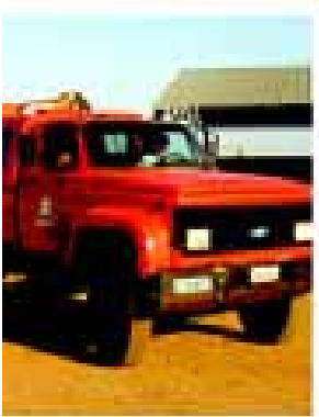
Um dos outros que estavam sucateados