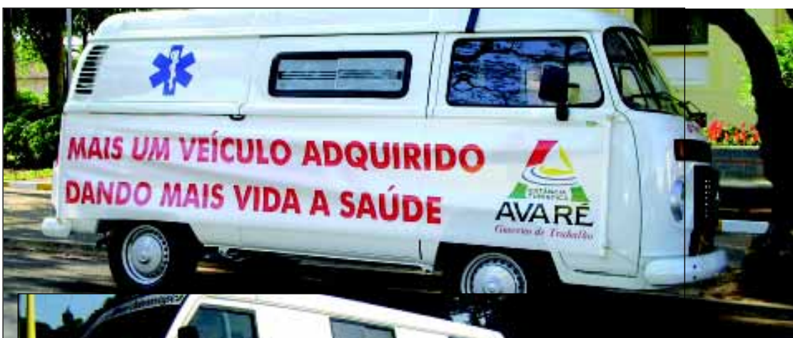
Veículos novos dão mais segurança e conforto para população