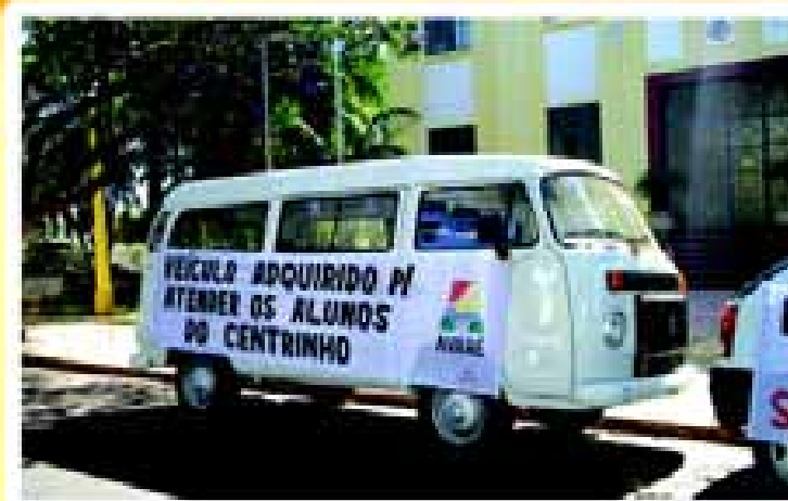
Centrinho tem um veículo que auxilia no trabalho