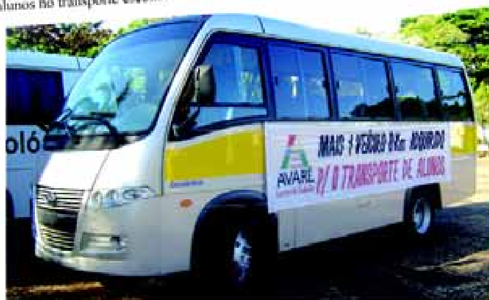
Transporte escolar é tratado com respeito pela Prefeitura

Com essa renovação a Prefeitura pretende manter a frota de veículos na área de educação sempre atualizada, com veículos novos proporcionando segurança aos alunos no transporte escolar.