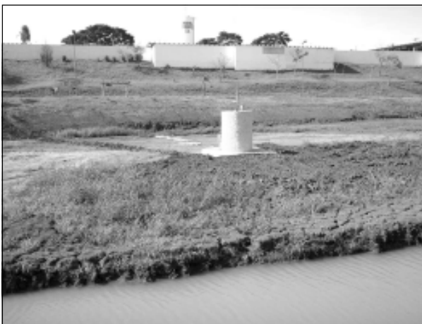
Chafariz está sendo construído no lago de entrada da cidade

A Prefeitura da Estância Turística de Avaré continua com os trabalhos para a construção de um grande chafariz na entrada da cidade. A obra está sendo realizada no Lago Manoel Rodrigues, na entrada da cidade. Para executar os trabalhos a Prefeitura precisou esvaziar o lago, mas que voltará a ter o seu volume de água normalizado, assim que a obra estiver encerrado.