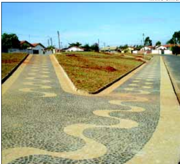
Trabalho na praça está na reta final

A Prefeitura da Estância Turística de Avaré está encerrando os trabalhos de construção