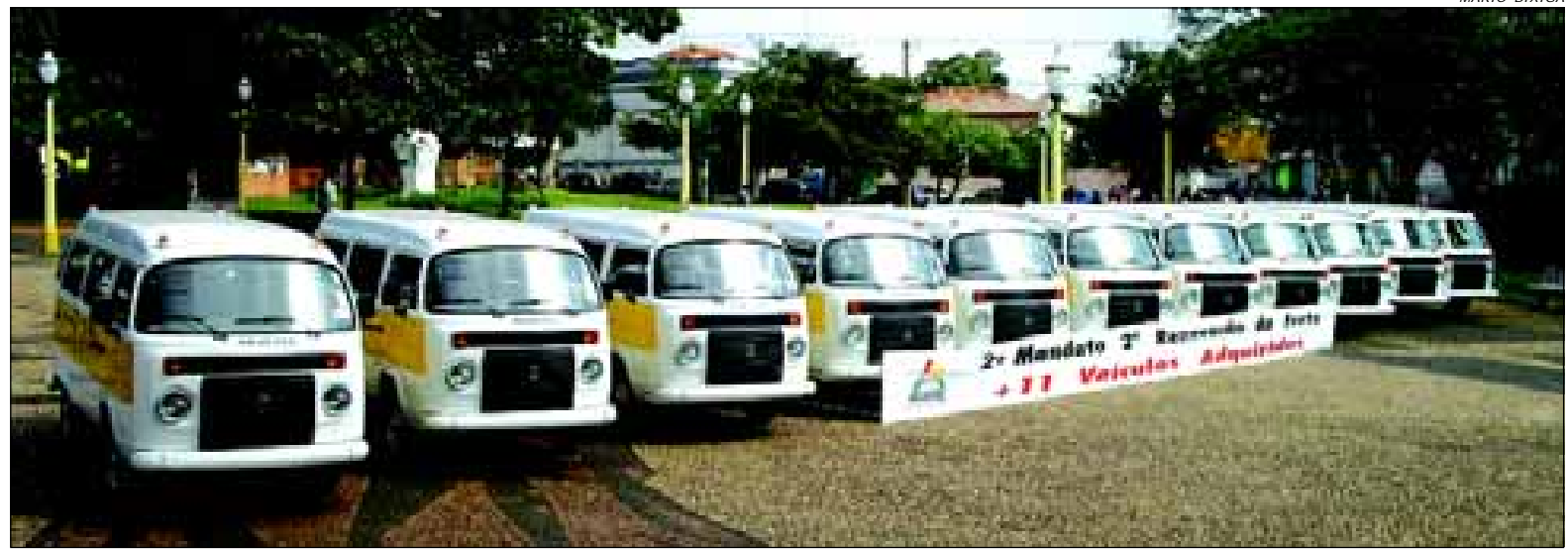
Pela segunda vez a Prefeitura renova toda a frota municipal

Além destes veículos a prefeitura já adquiriu outros 10 micronônibus que servirão para o