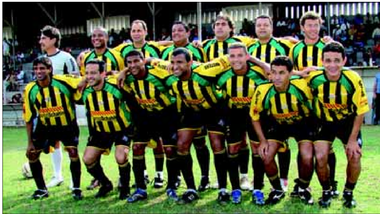
Seleção Paulista de Máster contou com grandes nomes do futebol

Na preliminar, houve um derby dos anos 80 entre as equipes do Corinthians e Resto do Mundo. O placar foi 3 a 0 para o Corinthians.