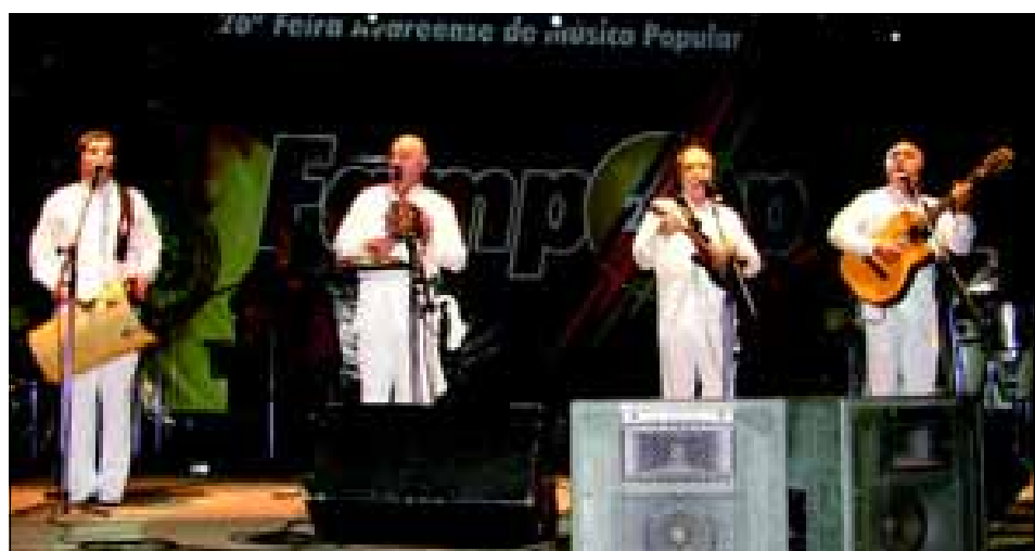
O grupo Demônios da Garoa agitou o público presente com show no dia 13