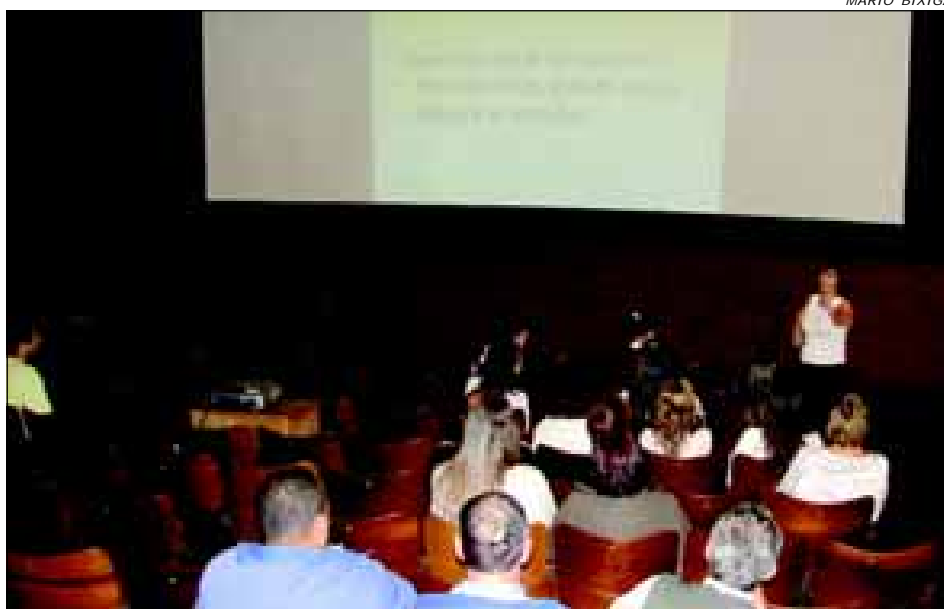
A palestrante enfatizou que a Saúde deve ser tratada não só no que se refere à doença, mas para as pessoas com saúde.