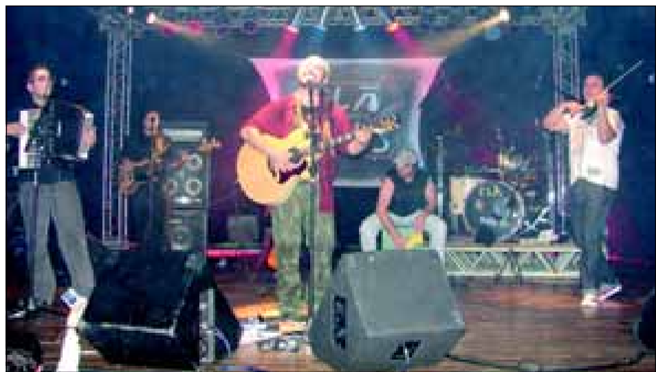
A banda avareense Clã Destinos abriu o festival no dia 10, com show no Teatro Municipal

Festa avareense A festa da premiação das músicas vencedoras da FAMPOP foi toda dos músicos