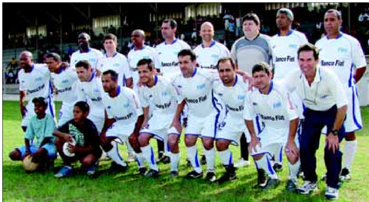
Seleção Avareense perdeu pelo placar de 3 a 1