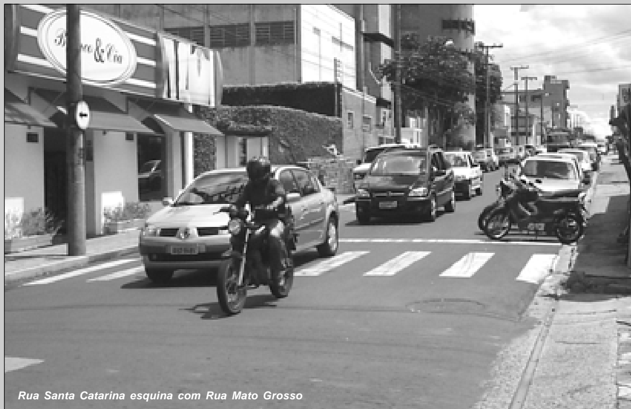
Rua Santa Catarina esquina com Rua Mato Grosso

SECRETARIA MUNICIPAL DOS TRANSPORTES E SISTEMA VIÁRIO DEMUTRAN - DEPARTAMENTO MUNICIPAL DE TRÂNSITO