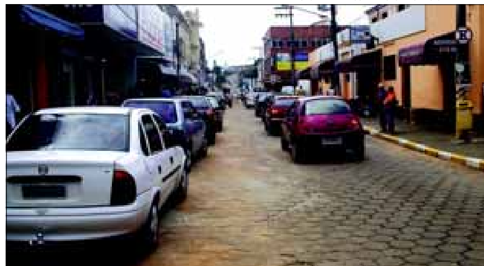
Estacionamento paralelo a calçada dão maior fluidez no trânsito