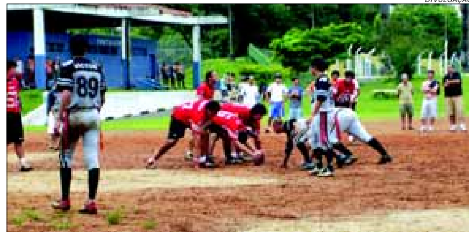
Time conquistou a vaga para o principal torneio da modalidade em São Paulo, o Torneio Paulista de Flag Football

Com este resultado, o AVARÉ BLACK HORSE volta aos seus treinamentos para aprimorarem-se ainda mais as posições e jogadas, pois o Torneio Paulista está previsto para a primeira semana de Abril e a Taça Brasil de Flag (organizada pela Associação Portuguesa de Desportos) com início previsto após o mês de Maio. Como preparativo, no próximo final de semana, a equipe de Avaré fará um amistoso em Barretos, contra os donos da casa, os CARCARÁS DE BARRETOS. Contudo, quem queira conhecer ou fazer parte da Família BLACK HORSE, é só comparecer aos treinamentos que serão data-