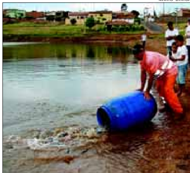
Serão mais de 10 mil quilos de peixes soltos no Lago

A Prefeitura da Estância Turística de Avaré já começou a soltar os peixes no Lago Berta Banwart no Brabância