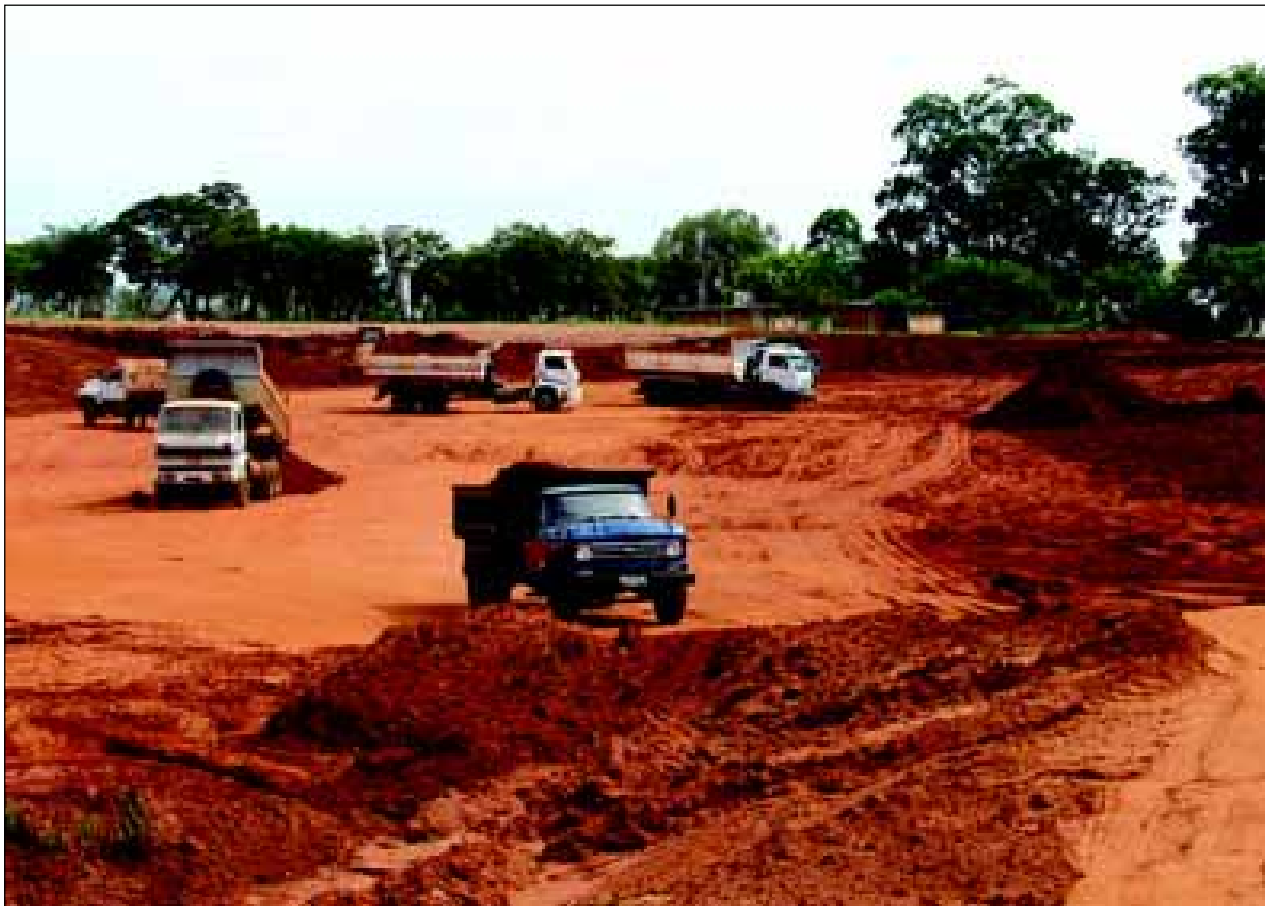
Obras de escavação e construção de aterros laterais

Vale ressaltar que o Arenão está sendo gerido e executado pela Prefeitura da Estância Turística de Avaré com verbas do DADE-Departamento de Apoio ao Desenvolvimento das Estâncias do Estado de São Paulo, órgão vinculado a Secretaria Estadual de Economia e Planejamento.