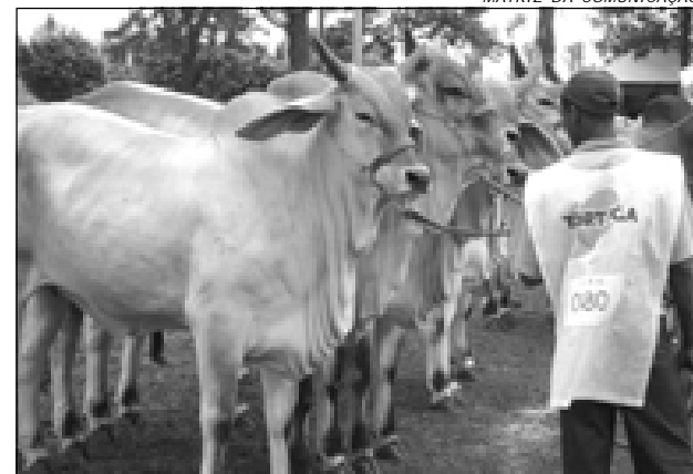
MATRIZ DA COMUNICAÇÃO

Ainda de acordo com os organizadores, a Emapa se consagrou como uma pista que não tem criador que traz animal para fazer número, mas sim animais que têm condições pra vencer em qualquer outra pista que venha disputar. Isso torna o trabalho de julgamento prazeroso, pois o que se vê nas pistas de julgamentos são animais que servem de referência para a pecuária brasileira, animais de nível extremamente competitivo.