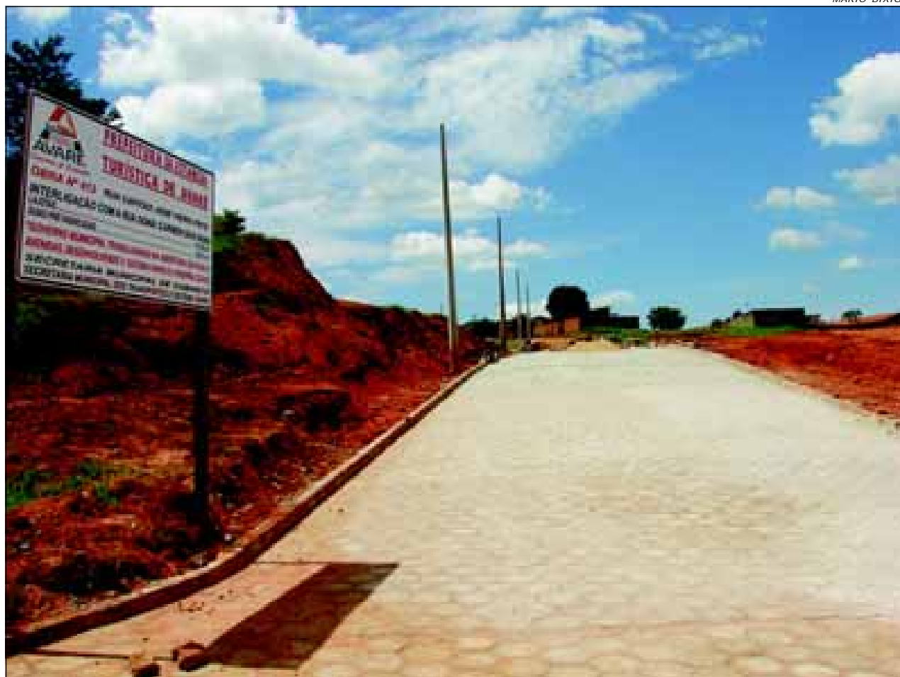
Rua Capitão José Vieira Pinto fará ligação das ruas Carmem Dias Farias e Três Marias

Com o objetivo de expandir a malha viária da cidade, a Prefeitura da Estância Turística de Avaré iniciou os trabalhos para pavimentação do prolongamento da Rua Capitão José Vieira Pinto.