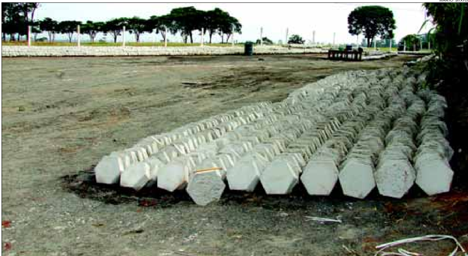
Lajotas são confeccionadas no próprio bairro Costa Azul

De acordo com a Prefeitura da Estância Turística de Avaré o projeto de pavimentação beneficiará as Avenidas Caminho da Praia, Marginal da Mata, Costa Azul, Leais Paulistanos, do Progresso e Grande Lago e as Ruas Cantinho do Mar e dos Imigrantes.