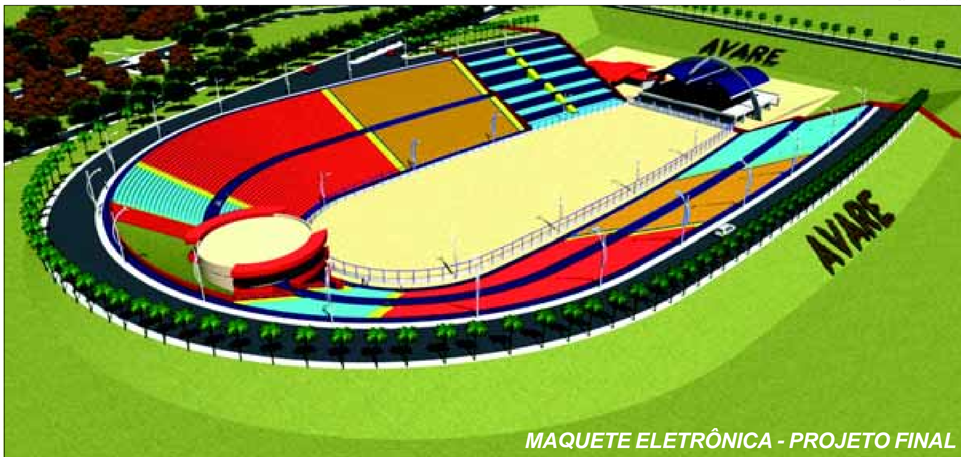
MAQUETE ELETRÔNICA - PROJETO FINAL