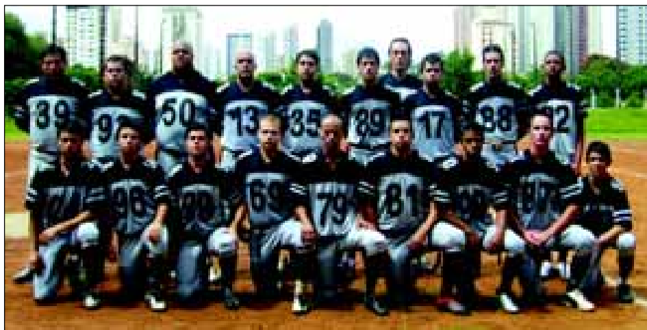
Avaré Black Horse conquistou o campeonato da 2ª Divisão

Na tarde do último sábado, dia 1º, o time de futebol americano, Avaré Black Horse conquistou o campeonato da 2ª Divisão e a vaga para disputar o Torneio Paulista em Abril.