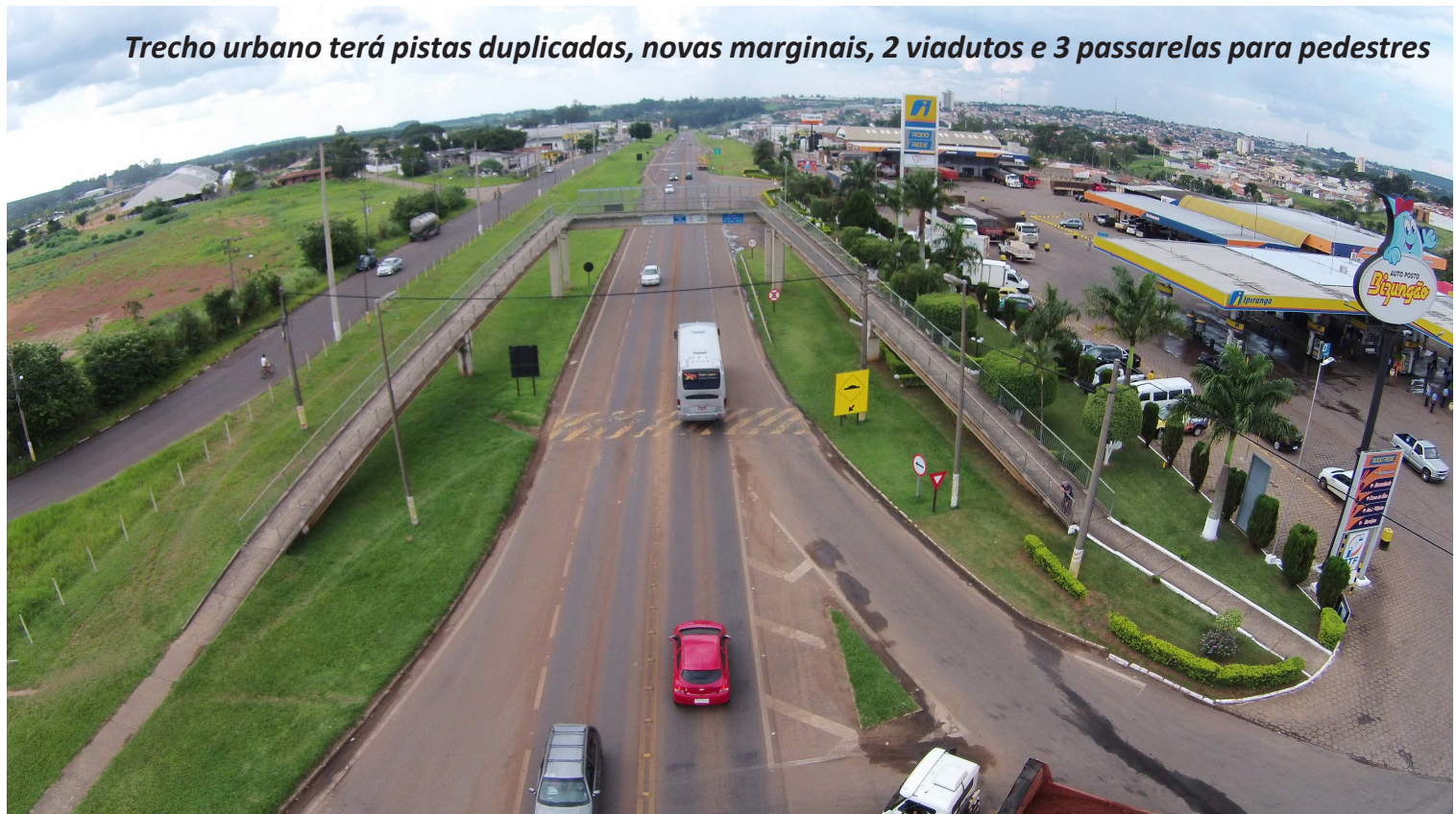
Trecho urbano terá pistas duplicadas, novas marginais, 2 viadutos e 3 passarelas para pedestres