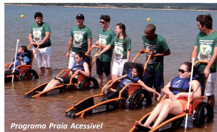
Programa Praia Acessível

O Praia Acessível, lançado em 2010 pela Secretaria de Estado dos Direitos das Pessoas com Deficiência, fornece cadeiras anfíbias com o