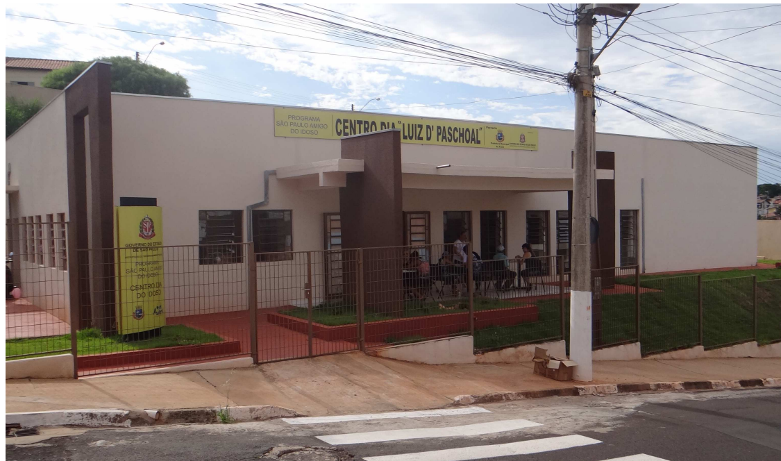
Centro Dia Luiz D' Paschoal

As instalações, onde foram investidos R$ 330 mil, tem acessibilidade e dispõe de recepção, sala de atendimento, cozinha, refeitório, sala administrativa, ambulatório, salas de TV e de jogos, ambientes de descanso separados por alas masculina e feminina e banheiros adaptados.