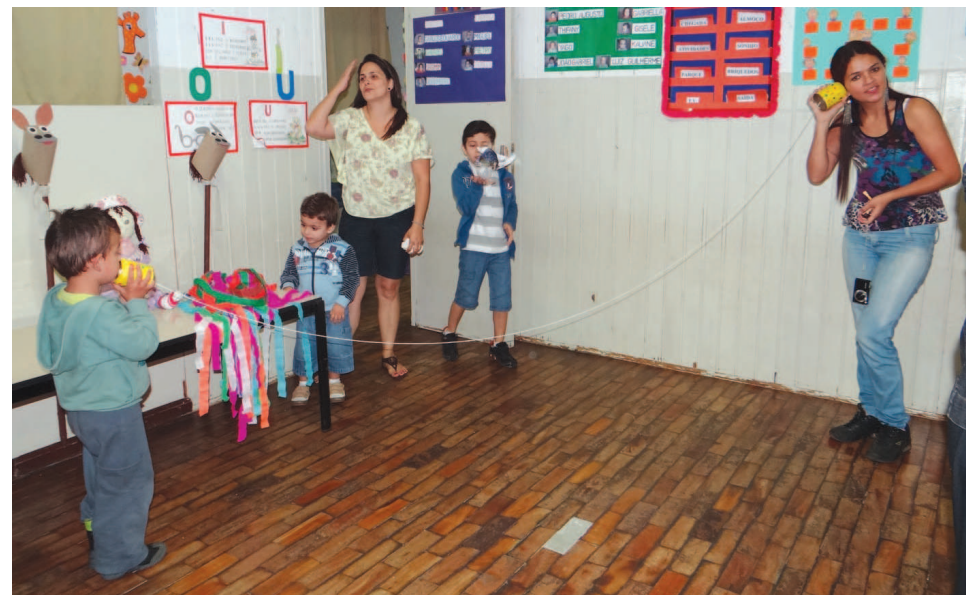
Mãe brinca com seu filho com telefone de lata

na qual os pais participaram de uma divertida competição de trava línguas e o que é o que é? A interação pais e filhos foi um momento marcante para a exposição. “Um resgate da infância”, afirmaram alguns pais. Ao final, foram servidos chás típicos e uma deliciosa canjica.