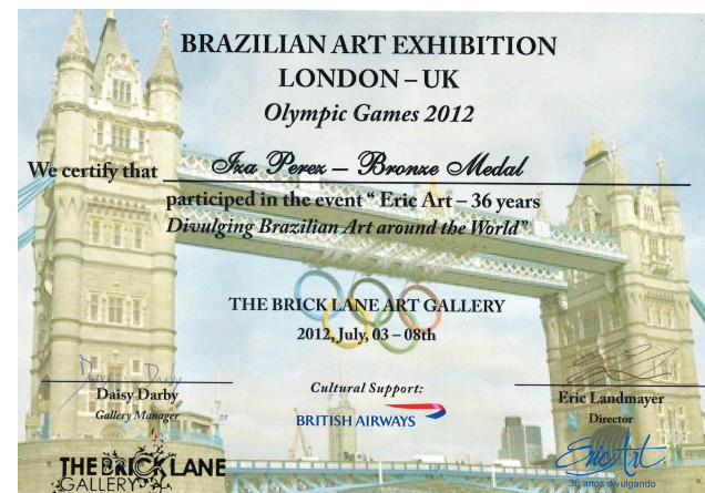
Certificado comprovando a terceira colocação em Londres