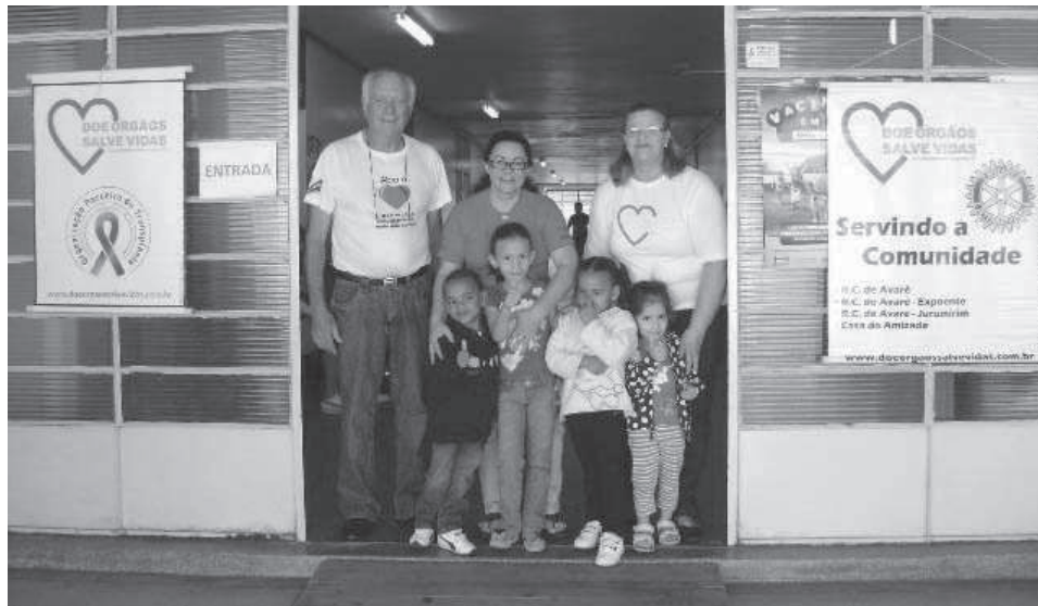
Doe Órgãos participou da Campanha contra a Poliomielite e da 31ª Edição do Projeto Prefeitura no Bairro

No último dia 06, aconteceu uma ação social nas dependências do Posto Bizunguinha que atendeu 169 pessoas com