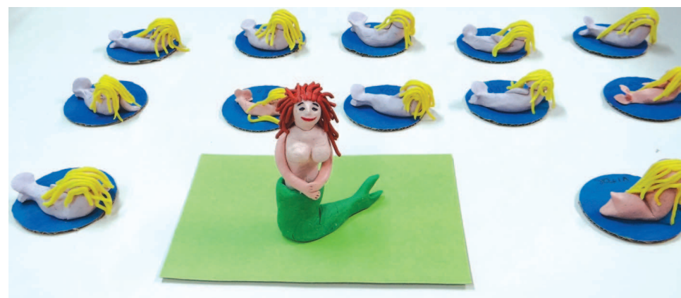
Trabalhos feitos em massa de modelar