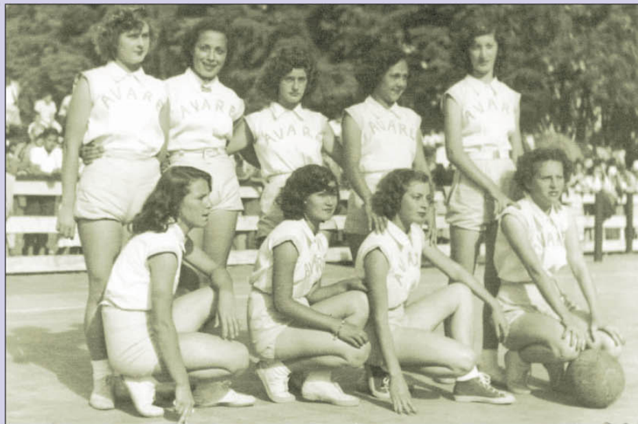
Equipe avareense feminina campeã de voleibol

Na classificação geral dos Jogos de 1951 Avaré despontou como a grande vencedora com 105 pontos, seguida por Presidente Prudente (57) e São Manuel (38).