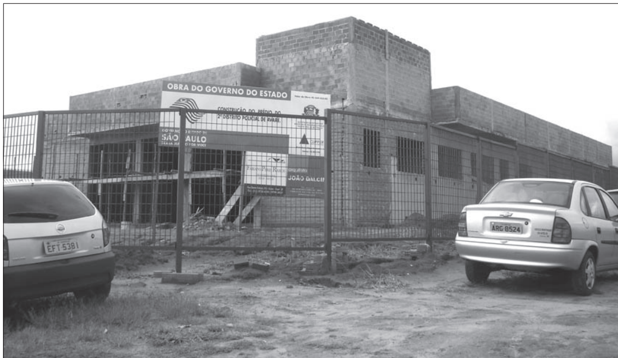
Obra do 2º Distrito Policial no bairro Santa Elizabeth

A obra é uma parceria da Prefeitura Municipal da Estância Turística de Avaré, que doou a área, com Secretaria de Estado de Segurança Pública e a verba total para construção é de R$ 570.132,87. Dr. Jor-