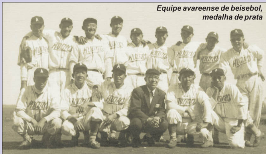
Equipe avareense de beisebol, medalha de prata