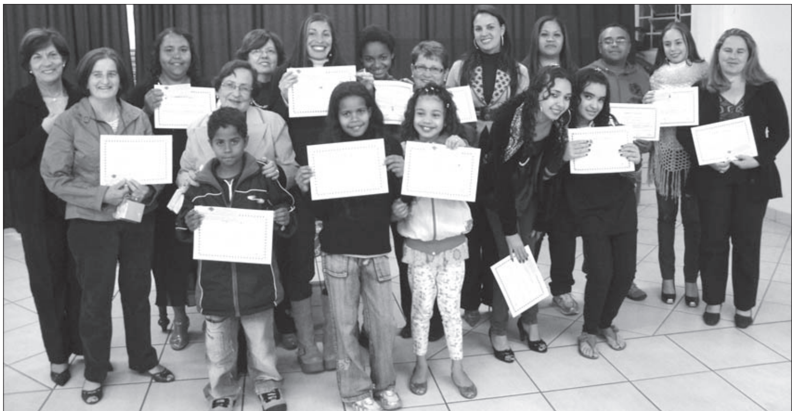
Alunos que receberam o diploma de conclusão do curso

Para o primeiro semestre de 2011 a Paróquia disponibilizará quarenta e cinco vagas e as inscrições estão abertas e irão até o dia 25/01/2011. Para se inscrever a pessoa deverá se dirigir até a secretaria da Paróquia São Benedito à Rua Pedro La Santine 50 - Centro. Os cursos contemplam: Windows, Word, PowerPoint, Excel e Internet.