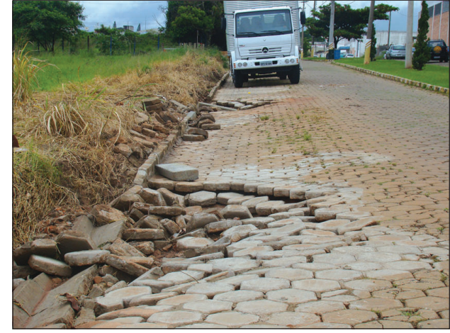
Avenida Presidente Kennedy

As fortes chuvas das noites de segunda e terça-feira deixaram um rastro de destruição em Avaré. Os maiores estragos foram provados pela chuva de terça-feira, onde, no Bairro Ponte Alta, logo após a escola da localidade, parte do asfalto não aguentou e foi levado pela