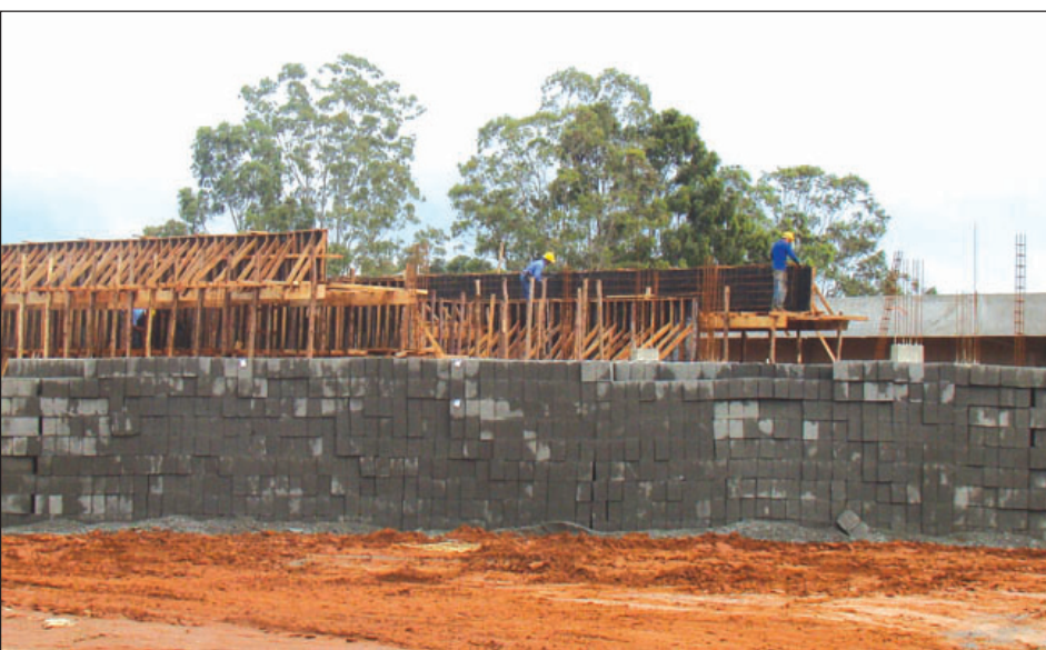
Homens trabalhando na construção da escola do SESI

Com o empenho da equipe do Departamento de Convênios, da Secretaria de Indústria e Comércio e Desenvolvimento Econômico, e também da Secretaria de Obras e apoio incondicional do Prefeitura Municipal, em parceria com o Serviço Nacional de Aprendizagem Industrial -, Avaré receberá investimentos de onze milhões de reais e terá uma unidade educacional do SESI – Ser-