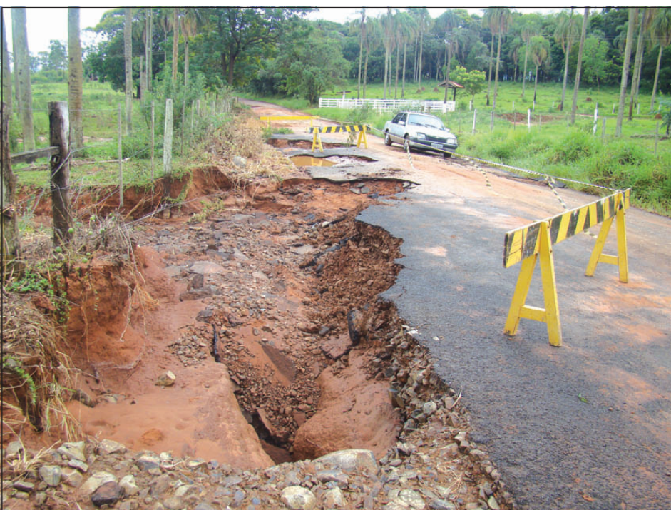
Estragos na estrada da Ponte Alta