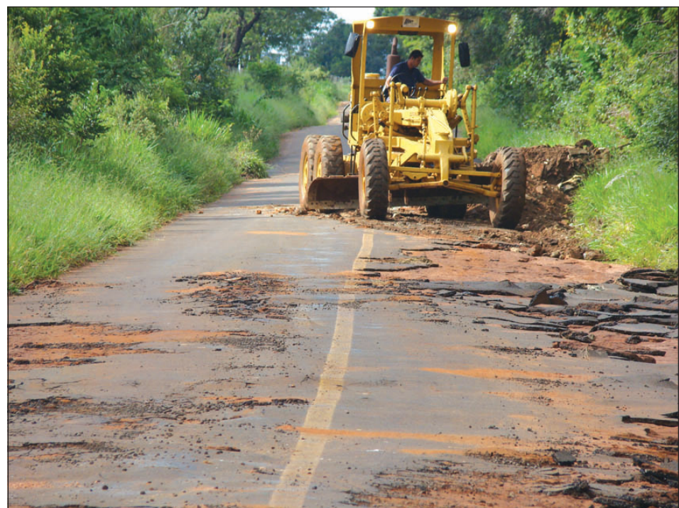
Máquina trabalhando na recuperação da estrada

A Prefeitura agiu rápido para conter os estragos causados pela forte chuva de terça-feira, 11. Com a atípica quantidade de água e a força das enxurradas, buracos e quedas de barrancos foram identificados em vias de grande fluxo e na área rural.