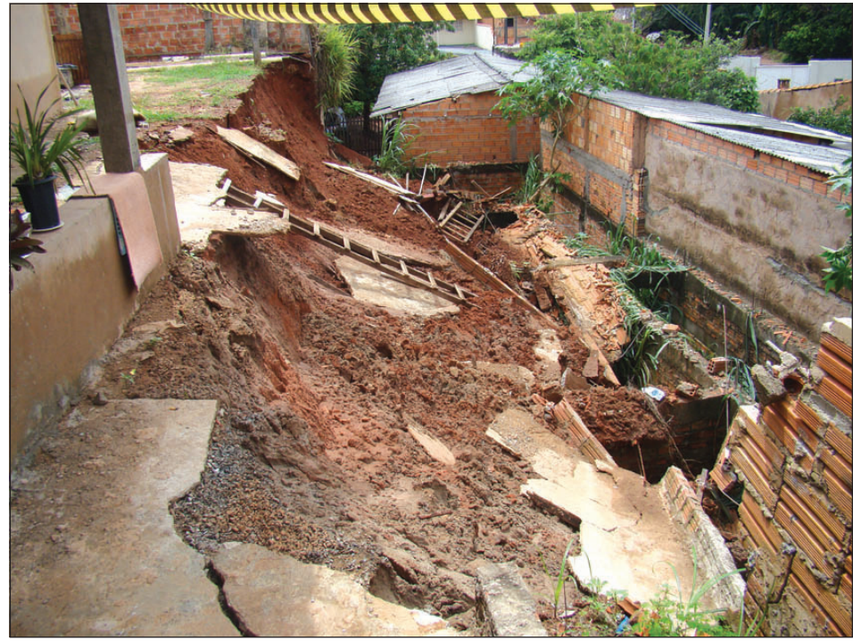
Casa no Bairro Colina Verde