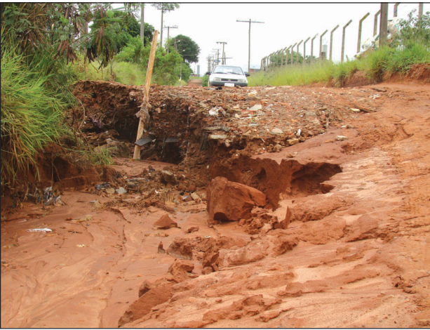
Estrada rural Haras Itaguaçu