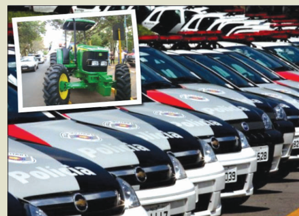
Novos veículos serão apresentados hoje à população

Os veículos já estão em circulação e foram obtidos graças as parcerias com os governos do Estado e Federal, bem como com recursos próprios. Além disso, Avaré recebeu três novas viaturas para a Polícia Militar, uma Blazer para a Força Tática, uma Blazer para escolta de presos e um Gol para a ronda escolar.