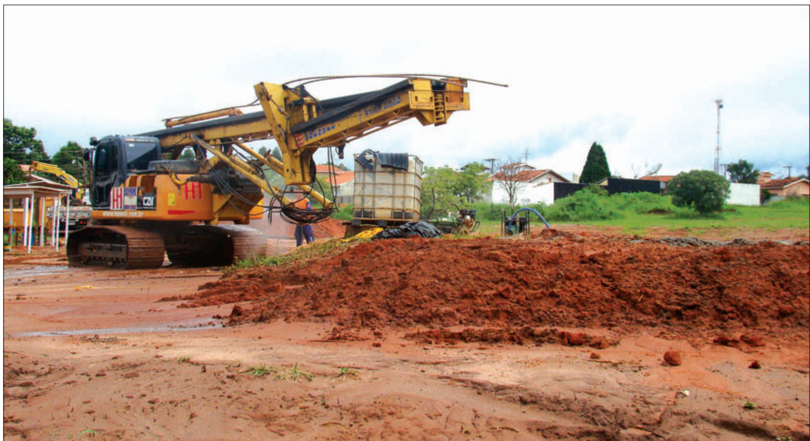
Máquina trabalhando na implantação das estacas

A previsão agora é que o novo Fórum de Avaré seja inaugurado em dezembro. O valor do projeto é de R$ 10.430.146,45. O novo Fórum será construído em sistema de módulos e o primeiro bloco a ser edificado será o salão do júri, que será em concreto armado. O restante do prédio será em sistema pré-fabricado, o que agiliza o tempo da obra, que contará com 3