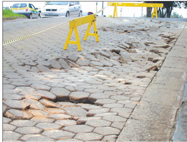
Rua Lineu Prestes