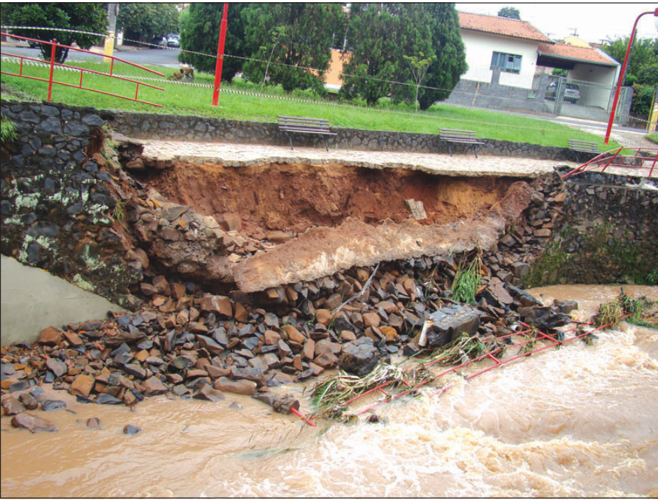
Muro de arrimo na Praça Brasil-Japão