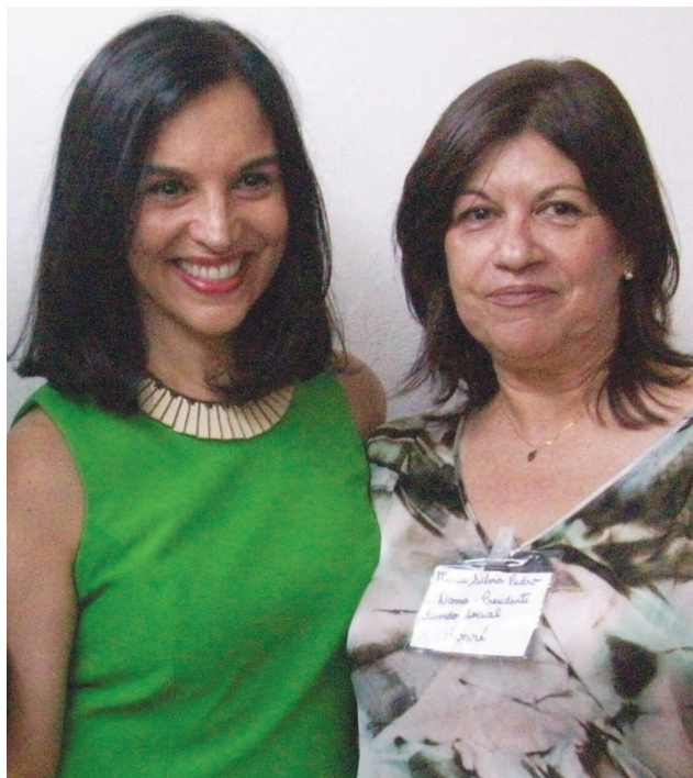
Primeira-dama do Estado Lu Alckmin e primeira-dama de Avaré Maria Silvia Pedro

O trabalho foi desenvolvido em parceria entre o município e o governo do estado. A Escola da Moda, projeto que capacita e colabora para geração de emprego e renda, é um programa de qualificação profissional desenvolvido pelo Fundo Social de Solidariedade de São Paulo e Secretaria de Estado do Emprego e Relação do Trabalho e Fundo Social de Solidariedade. A