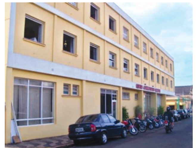
Centro Administrativo, localizado na Rua Rio Grande do Sul nº 1810

Artista plástica de origem popular, a avareense Djanira da Motta e Silva (1914-1979) manteve, em seu tempo, relacionamento com personalidades expressivas da intelectualidade e da política, muitas delas admiradoras do seu estilo genuinamente nacionalista. Páginas 18 e 19.