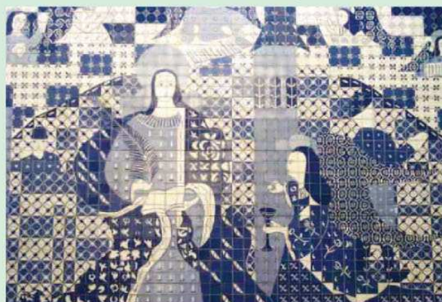
Painel de azulejos “Santa Bárbara e as Operárias”, no Rio de Janeiro