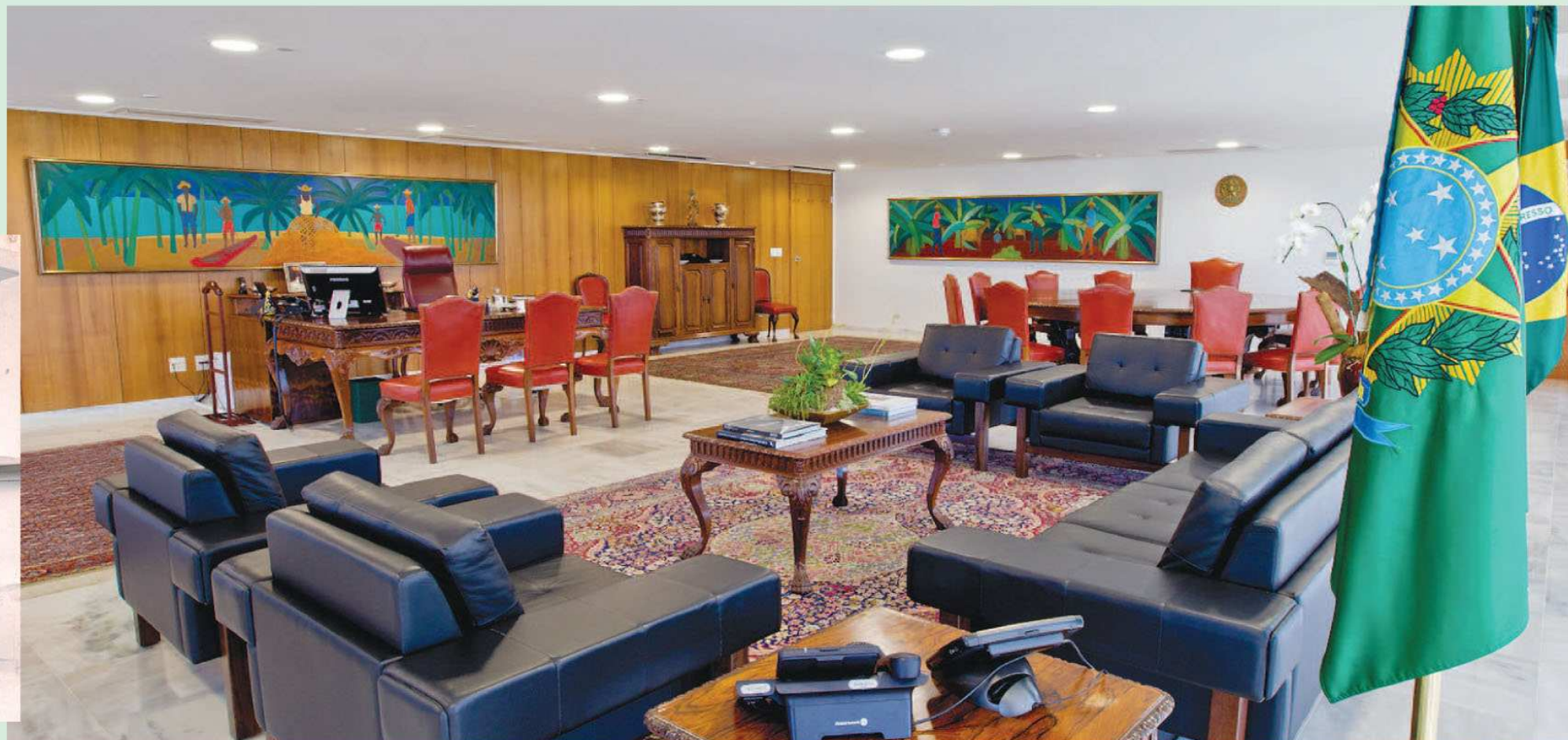
Gabinete de despachos da Presidência da República no Palácio do Planalto: nas paredes as telas “Praia do Nordeste” e “Bananal”, obras da pintora avareense Djanira em Brasília

e o Palácio dos Leões. “Tenho raízes plantadas na terra, não traio minhas origens, nem me envergonho de ser uma nativa”, dizia.