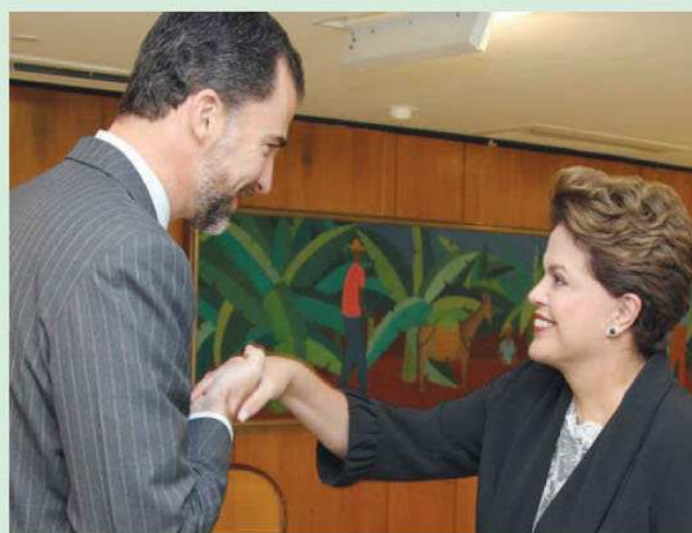
O príncipe das Astúrias, herdeiro do trono espanhol, cumprimenta a presidente Dilma, tendo ao fundo uma tela de Djanira.

Criadora de um conjunto de obras inteiramente nacionalista, a artista, numa simples frase, assim se auto-definiu: “Sou formalista, sou Brasil, sou Djanira”.