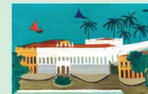
“Palácio dos Leões”