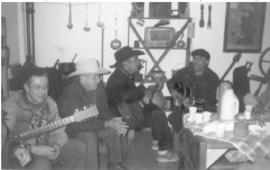
As reuniões acontecem a cada 15 dias, sempre às quartas-feiras

O Museu Anita Ferreira de Maria fica no Centro Cultural de Avaré, localizado na antiga CAIC.