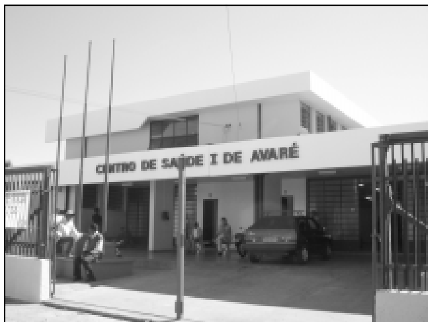
Reforma do Centro de Saúde – A Prefeitura da Estância Turística de Avaré está realizando uma importante reforma no Centro de Saúde da Rua Acre. O local está recebendo nova pintura para que seja mantido um bom aspecto para os freqüentadores do Centro de Saúde.