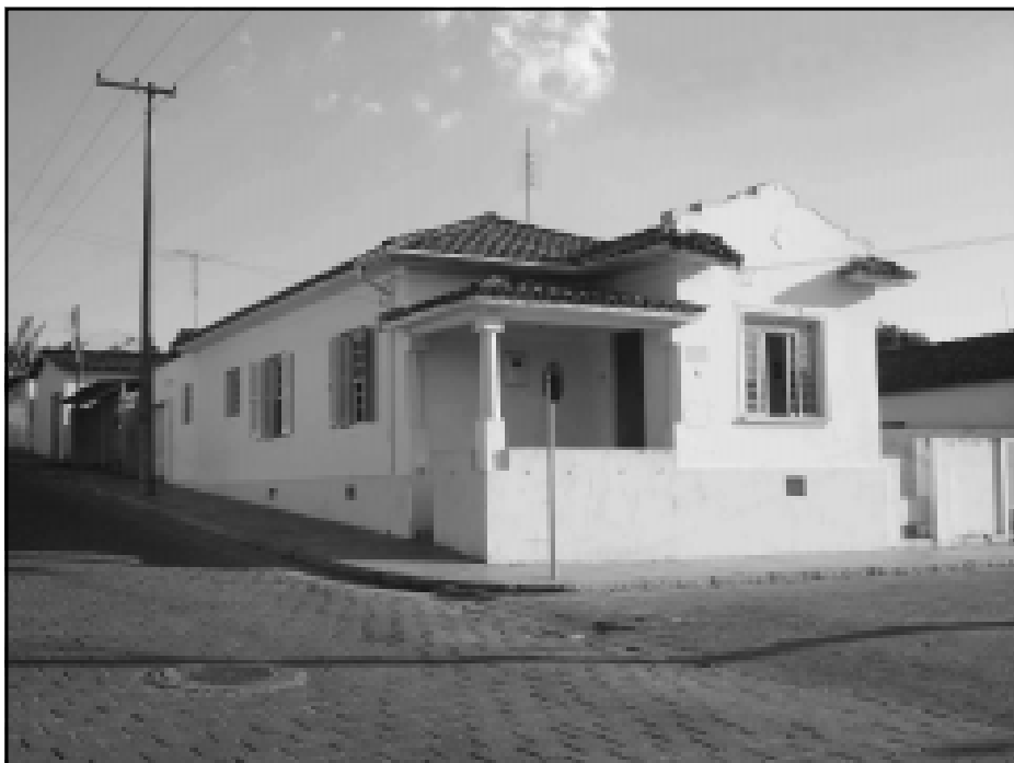
A CPMA funciona na Rua Pernambuco, 2330, esquina com a Rua Coronel João Cruz.

Implantada em Avaré graças a uma iniciativa da Prefeitura da Estância Turística de Avaré, em parceria com a Câmara Municipal, a Central de Penas e Medidas Alternativas (CPMA) foi inaugurada no último dia 05.