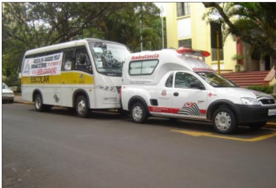
Ambos os veículos são 0km e foram repassados pelo Governo do Estado.

O outro veículo é uma ambulância da marca Chevrolet, modelo Montana, toda equipada para o transporte de pacientes.