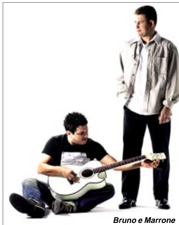
Bruno e Marrone