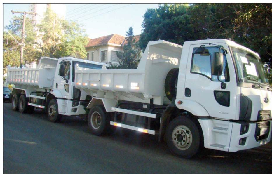
Caminhão caçamba toco e caminhão caçamba truck