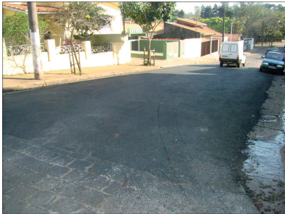
Trecho recuperado da rua Coronel João Cruz