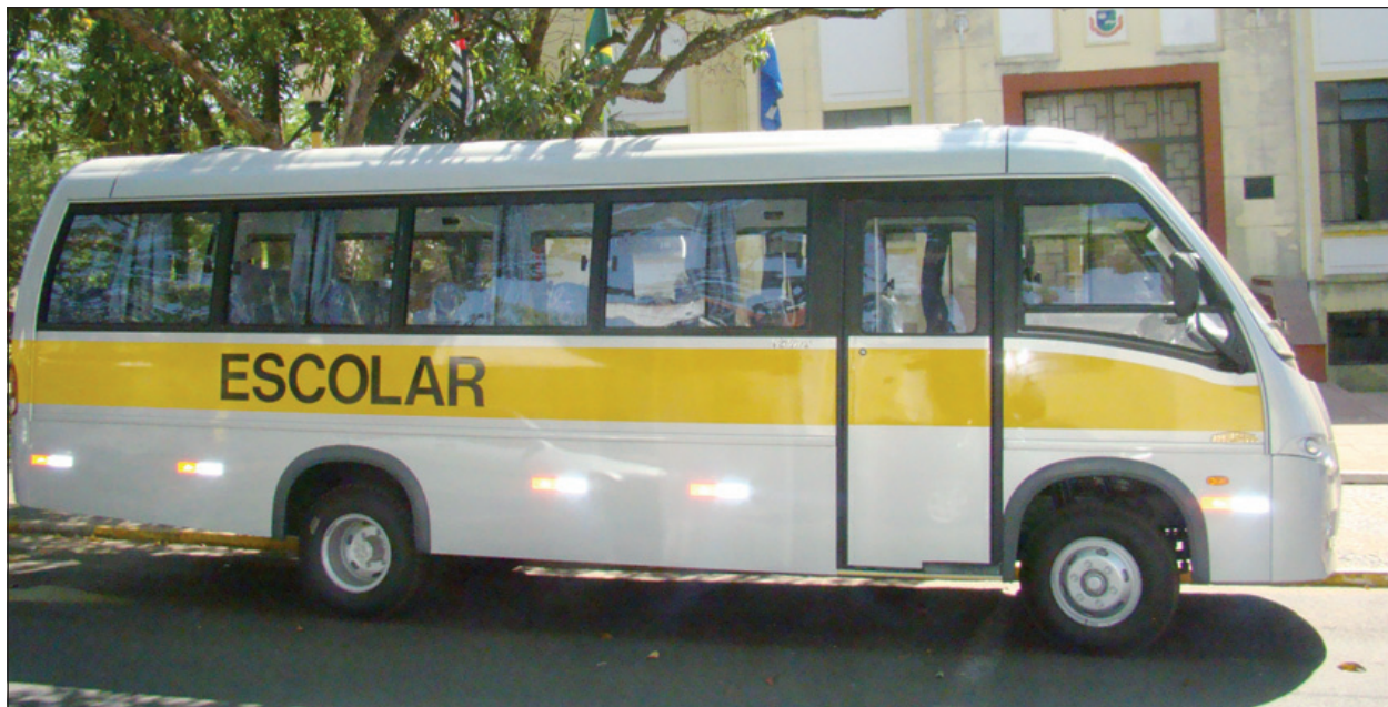
Microônibus adquirido pela Secretaria Municipal de Educação

Foram adquiridos ainda nove veículos para o transporte escolar, sendo eles um microônibus no valor de R$ 159.600,00 e oito kombis no valor de R$ 56.760,00 cada. O microônibus e mais três kombis já foram entregues ao município, que aguarda para os próximos dias a entrega dos cinco veículos restantes. Esses veículos foram ad-