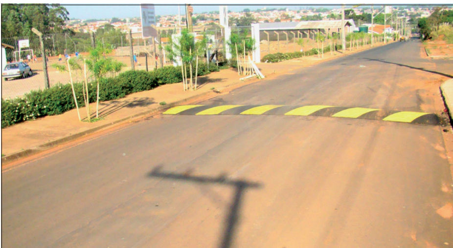
Redutor implantado em frente à Colônia Espírita Fraternidade

A mega operação de recuperação de vias públicas da Estância Turística de Avaré, proveniente de uma verba no valor de R$ 1.040 milhão destinada ao município pelo do Ministério da Integração Nacional, já apresenta resultados positivos para a cidade.