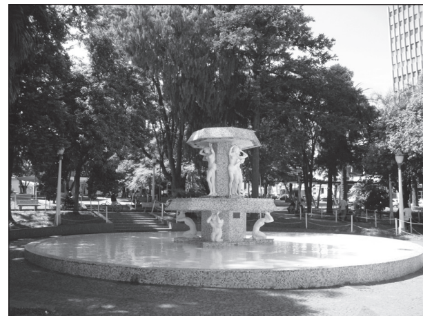
Largo São João