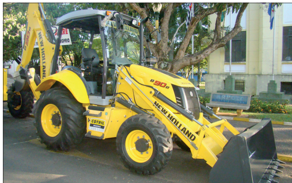
Retroescavadeira adquirida pelo município

No total, a aquisição desses 17 novos veículos resulta em um investimento de mais R$ 5 milhões em serviços de recuperação de estradas rurais, coleta de lixo e transporte escolar da Estância Turística de Avaré.