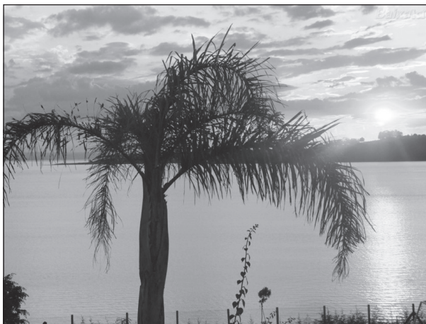
Represa de Jurumirim

Após a apuração, o ícone escolhido será revelado. Em setembro, mês de aniversário da cidade, a TV TEM produzirá uma série especial de reportagens abordando os principais aspectos que marcaram a história e o desenvolvimento da cidade.