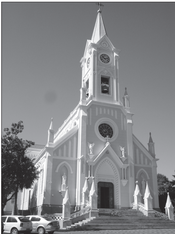
Santuário de Nossa Senhora das Dores

Os avareenses terão somente até a próxima segunda-feira para eleger o símbolo que representará Avaré nos seus 150 anos, a serem completados no dia 15 de setembro. É que em parceria com a TV Tem, a Prefeitura da Estância Turística de Avaré lançou o Projeto "Eleja Avaré", que escolherá o símbolo da cidade em seu sesquicentenário, que representará o município e todo seu potencial, história, cultura, tradições, características únicas e desenvolvimento.