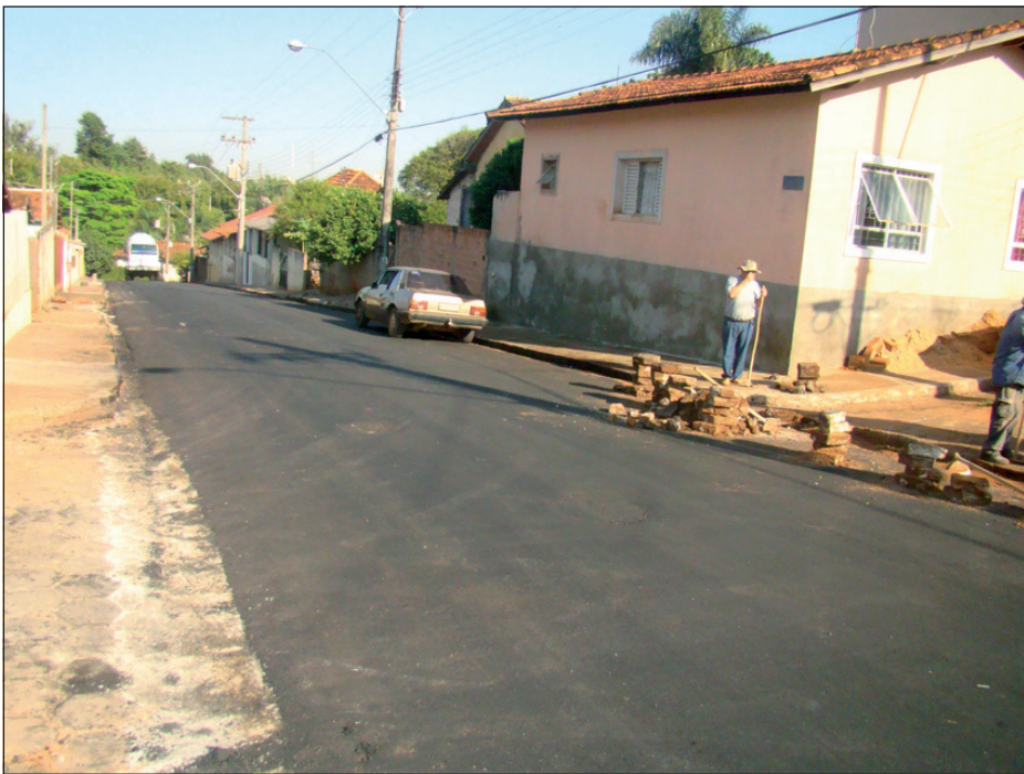
Recuperação da rua Profa. Danuzia D Santi