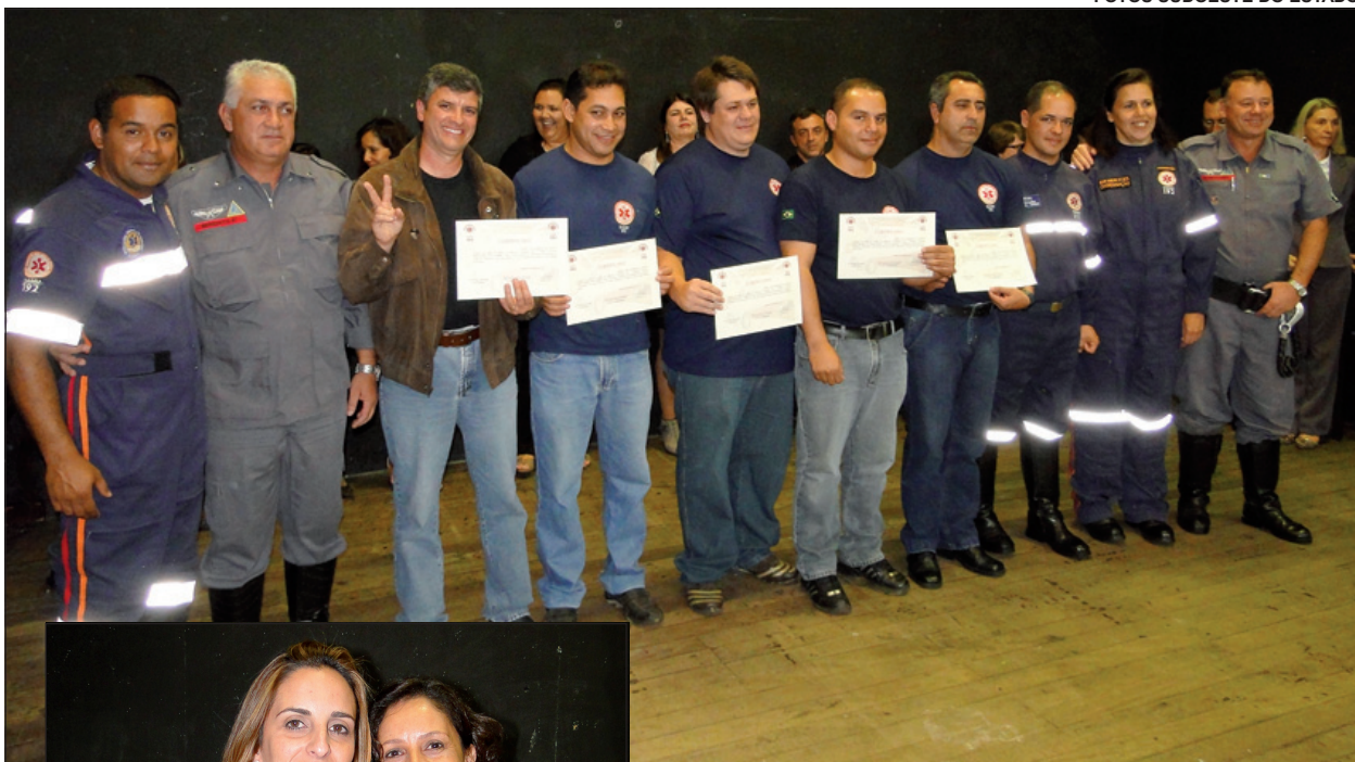
Diplomados do SAMU Regional Vale do Jurumirim

A família SAMU Regional Vale do Jurumirim – SAMU 192 gostaria de agradecer imensamente ao Corpo de Bombeiros de Avaré que gentilmente cedeu espaço para a realização do treinamento dos quase 100 profissionais da regional.