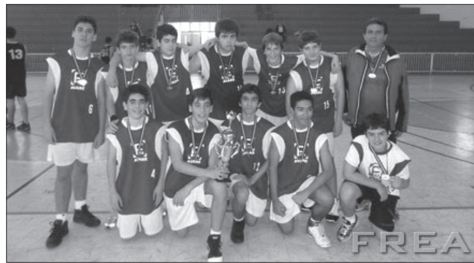
Alunos campeões do torneio

O Colégio Universitário de Avaré, mantido pela FREA - Fundação Regional Educacional de Avaré - participou nos dias 1 e 2 de julho do 1º Circuito