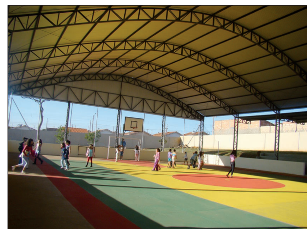
Entrega da cobertura metálica da quadra poliesportiva da EMEB “Maria Nazareth Abs Pimentel