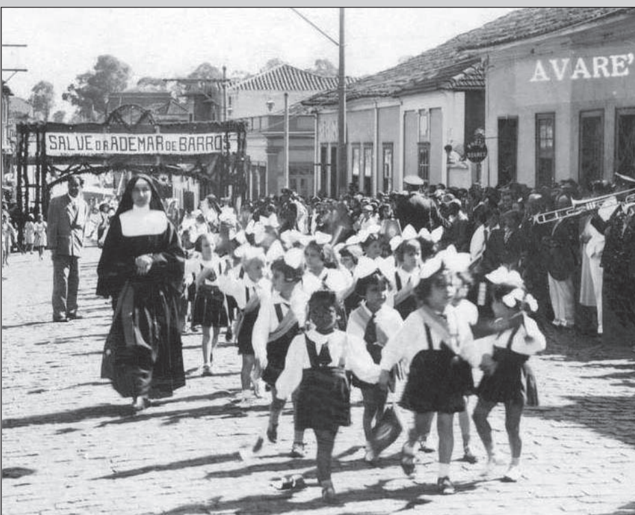
Irmã num desfile festivo em Avaré, 1940