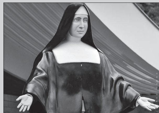
Estátua de Madre Paulina em Nova Trento (SC)

Paulina transferiu-se para São Paulo. Atenta e compassiva, amparou velhos ex-escravos, os quais ficaram marginalizados após a Lei Áurea, gerando grave problema social. Passou a ajudar idosos e doentes no interior.