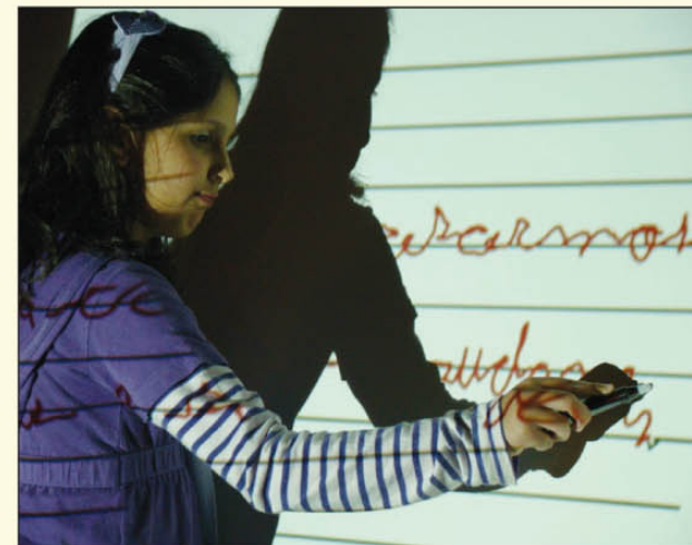
Inauguração de uma das 22 lousas digitais