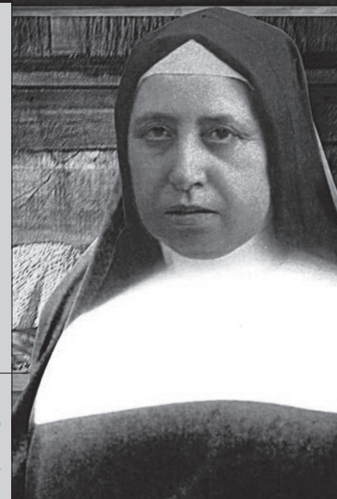
Santa Madre Paulina (1865-1942)

Por mais de 70 anos, até meados de 2009, a congregação de Santa Paulina atuou dinamicamente nas áreas de saúde e educação, deixando aos avarenses valioso legado de espiritualidade e solidariedade.