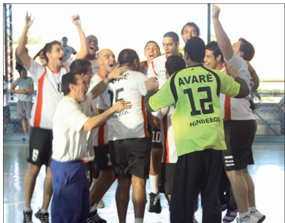
Equipe campeã comemora a vitória nos Jogos Regionais

e feminino, handebol masculino e feminino, futsal masculino e feminino, futebol masculino, vôlei de praia masculino e feminino, xadrez masculino e feminino, natação masculino e feminino, bocha, capoeira masculino e feminino, damas feminino e basquetebol masculino e feminino.