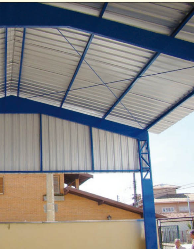
o pátio da EMEB Alzira Pavão

to Nacional da Raça Quarto de Milha – ABQM -, no Parque Fernando Cruz Pimentel; No dia 27, às 9h00, tem a reunião do Conselho Estadual de Segurança Alimentar e Nutricional