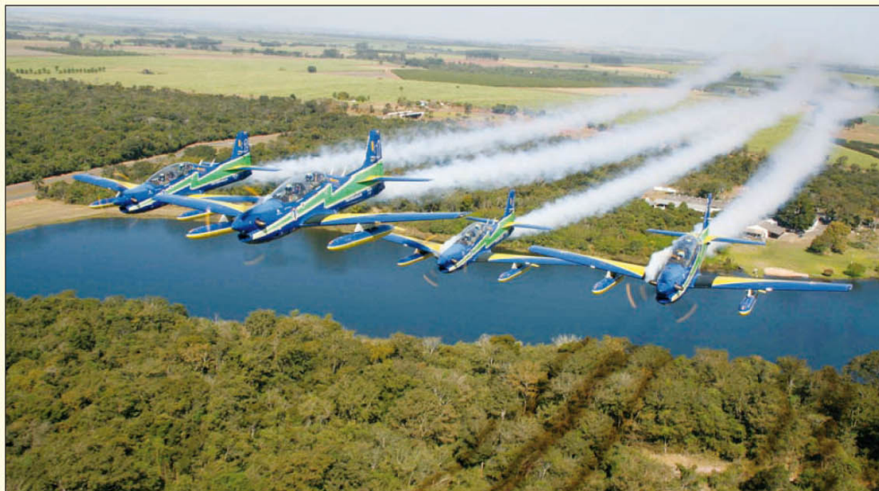
Apresentação da Esquadrilha da Fumaça será no dia 31 de julho