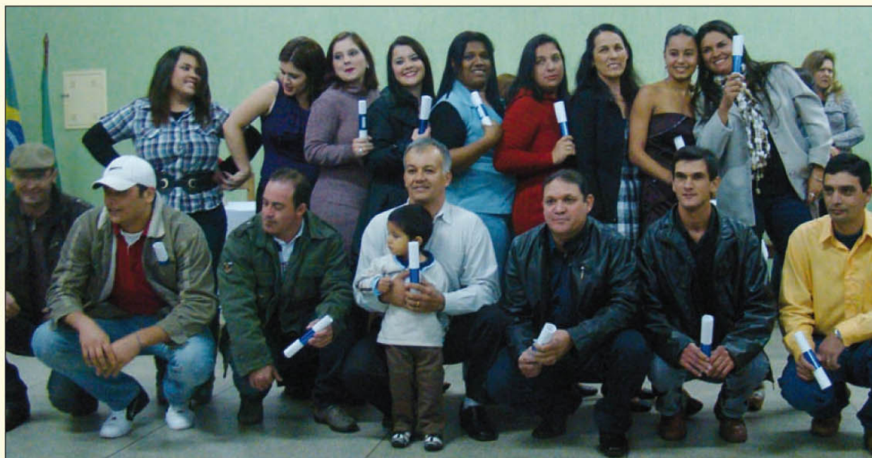
Formatura dos alunos do EJA