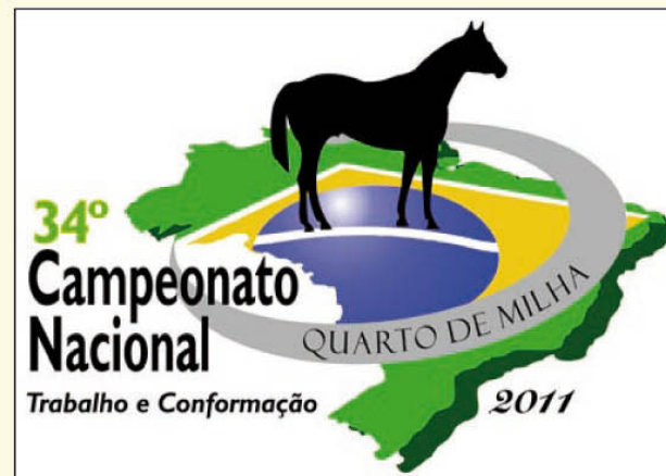
34º Campeonato Nacional da Raça Quarto de Milha, de 15 a 24 de julho

14h00 no Jardim Brasil, na Avenida Salim Curiatis/nº; às 15h00 no ESF Cecílio Jorge Netto, na Rua Benedito Ailton Camilo de Souza, 212; De 15 a 24 de julho será realizado o 34º Campeona-