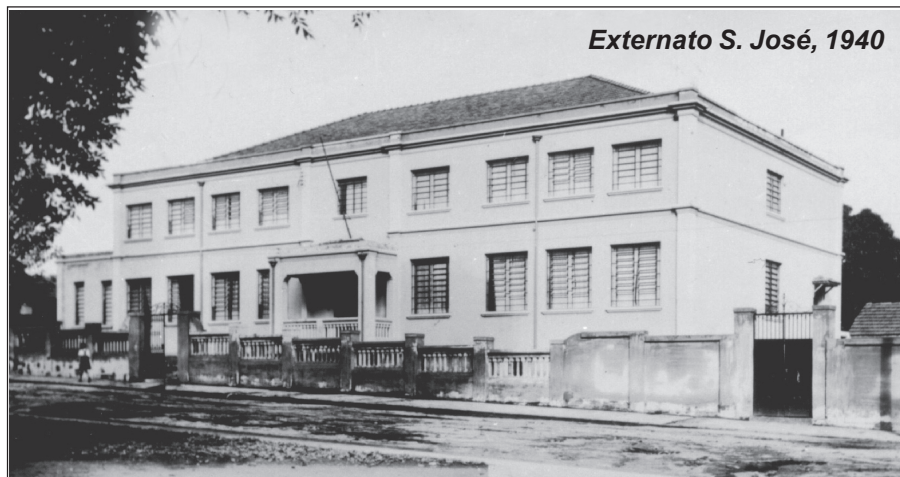
Externo S. José, 1940

Procedente de São Paulo, onde voltara a morar, pela terceira e última vez madre Paulina esteve na cidade em 1921. Veio, entre os meses de maio e junho, para animar as religiosas atuantes nas comunidades de Avaré, São Manuel e Itapeva.