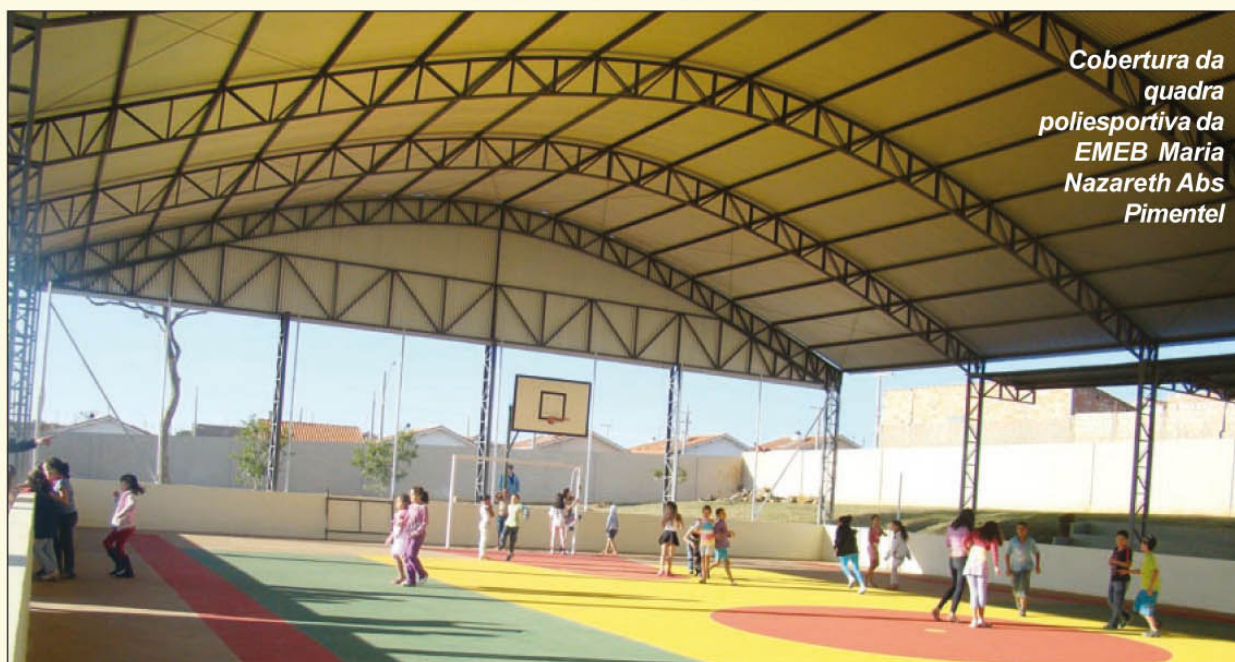
Cobertura da quadra poliesportiva da EMEB Maria Nazareth Abs Pimentel