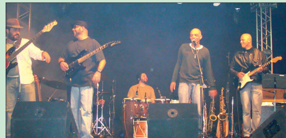
Banda Fratura Exposta voltou aos palcos da FAMPOP

A eliminatória avaréense é uma porta de entrada para os músicos de Avaré e região participarem do maior