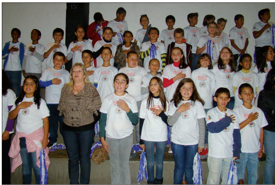
Alunos formandos do PROERD

Durante a cerimônia, as crianças fizeram três apresentações de dança, contagiando todo o público presente. A Banda Marcial da Escola Paulo Araújo Novaes ajudou a abrilhantar as noites com belas apre-