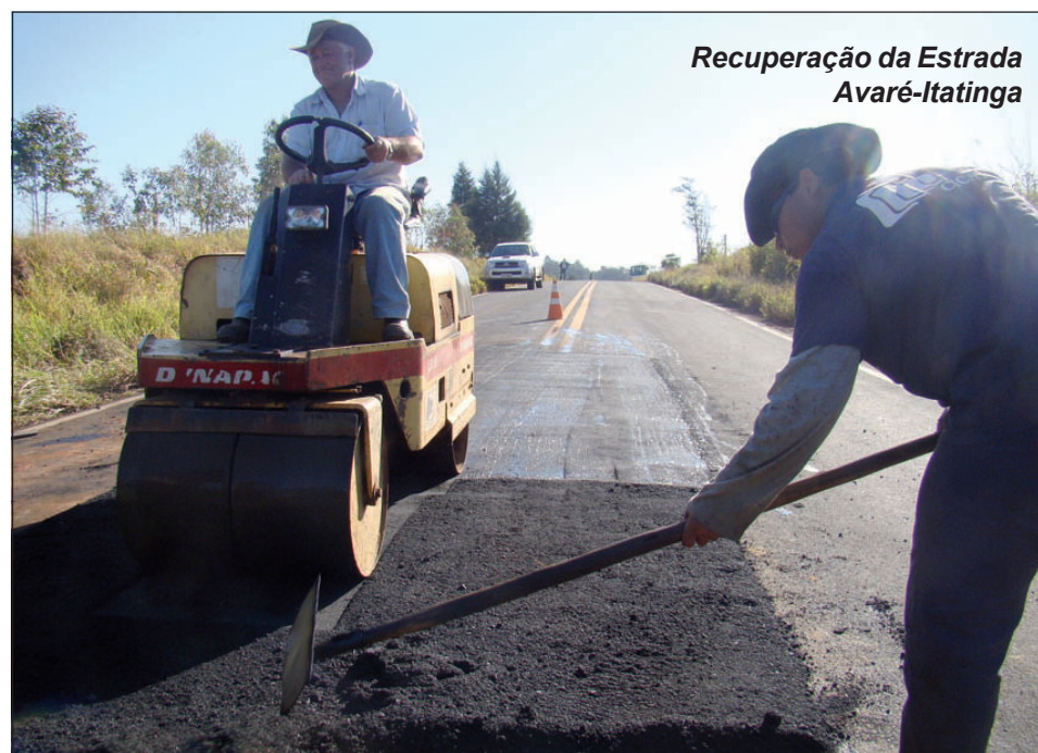
Recuperação da Estrada Avaré-Itatinga