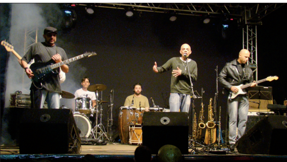
Banda Fratura Exposta