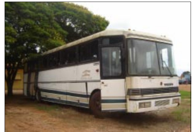
Ônibus que será leiloado

No próximo dia 21 de novembro a Prefeitura da Estância Turística de Avaré estará realizando o leilão de um ônibus e de cerca de 15 mil quilos de sucatas. Os bens serão leiloados em virtude de não estarem sendo mais utilizados pela municipalidade.