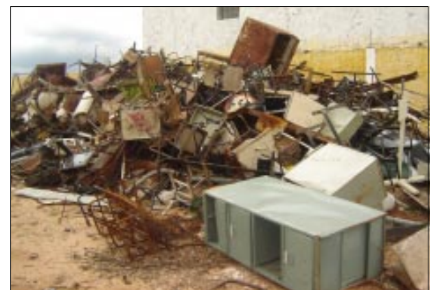
A sucata será leiloadada em lote fechado

Posteriormente a Prefeitura estará iniciando a construção do IML no local, mais uma importante conquista para Avaré.