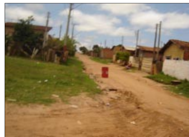
Bairros como Paraíso e Vila Esperança deverão ser pavimentados com verba do PCM