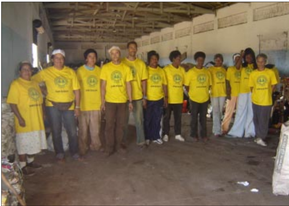
Catadores estão satisfeitos com os primeiros resultados

A Cooperativa dos Catadores de Avaré, a UNICOOP, está em plena atividade. Em pouco mais de um mês trabalhando, após o encerramento do antigo Lixão, os resultados já são altamente positivos. A UNICOOP acaba de conquistar uma linha telefônica, instalada pela Prefeitura, o que está facilitando os contatos com compradores do material coletado. O número do telefone é 3733 4755.