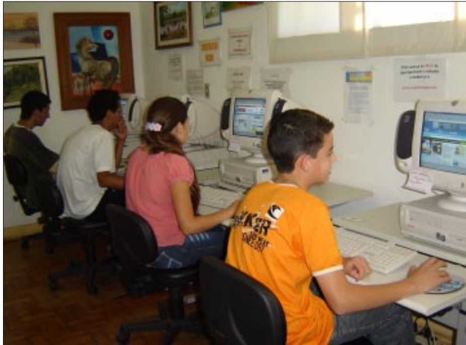
Infocentro disponibiliza acesso a internet gratuito

Para utilizar a Internet gratuitamente basta a pessoa ter mais de 11 anos de idade e se cadastrar na Biblioteca Municipal. Para fazer o cadastro é necessário apenas levar o RG e uma foto 3x4. Os me-