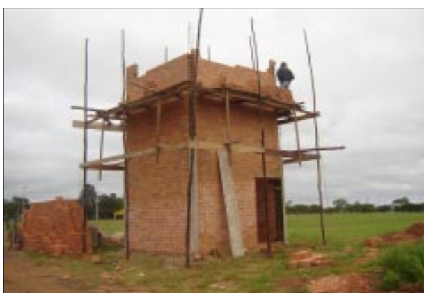
Casa de Energia na Emapa

Também está no plano da Prefeitura a reativação da iluminação da praia, desde o Camping até o Costa Azul. No local já existem os postes e a fiação, mas estava desativada. A Prefeitura pretende iluminar a praia, tornando assim mais uma atração para os turistas.