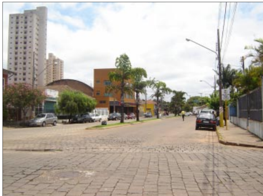
Avenida Major Rangel deverá ser pavimentada

mente a vida dos moradores destas localidades da periferia de Avaré. Nos próximos dias os moradores deverão ser chamados para participarem de reunião com a Caixa Econômica Estadual e a Prefeitura, onde terão todas as informações necessárias. Os recursos deverão ser da ordem de R$ 9 milhões e a empreiteira responsável deverá gerar dezenas de empregos para a população avareense nas obras.