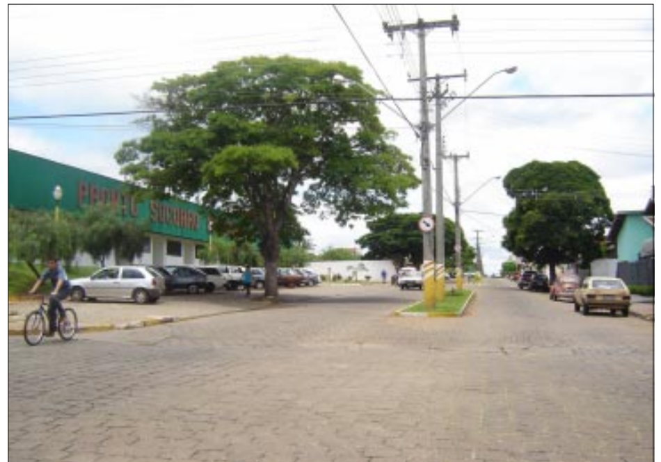
Avenida Pinheiro Machado será pavimentada em breve

fluxo de veículos naquela região. A Rua Lazaro Teixeira Felix faz a interligação da Rua Bela Vista com a Rua Três Marias.