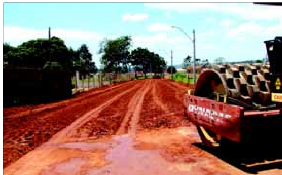
Travessa fará importante ligação do Bairro Camargo a Rua Carmen Dias Faria

A Prefeitura da Estância Turística de Avaré está providenciando a pavimentação da Travessa Congonhas. A obra está sendo realiza-