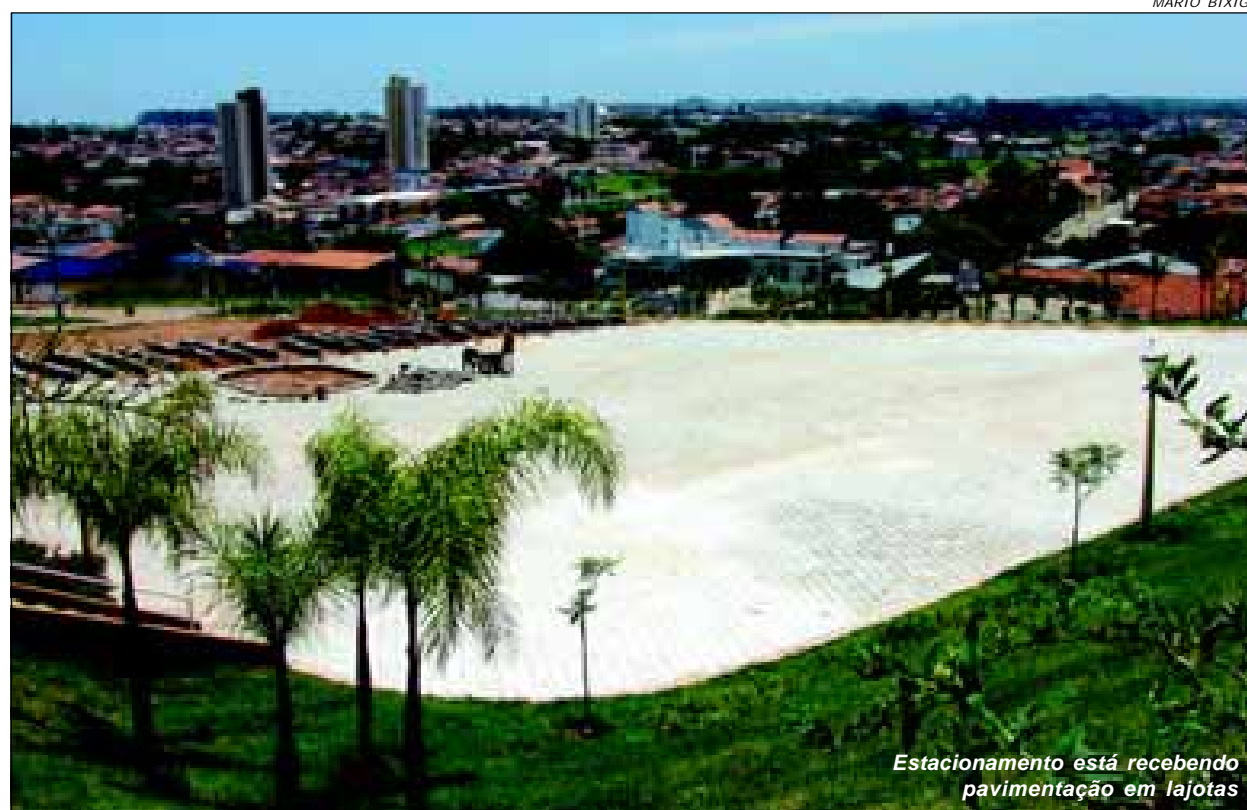
Estacionamento está recebendo pavimentação em lajotas

A Prefeitura da Estância Turística de Avaré está investindo para que a cidade fique cada vez mais iluminada. O projeto da Prefeitura é que até o Natal deste ano todas as ruas da cidade tenham iluminação com lâmpadas de vapor de sódio de 250 watts, a mesma utilizada nas ruas centrais e em alguns bairros da cidade. Página 8.