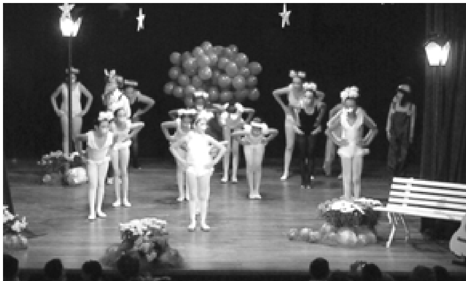
Alunos realizaram apresentações baseadas em textos e músicas de Vinicius de Moraes

Na última terça-feira, dia 13 de novembro, os alunos da rede municipal de ensino participaram de um Sarau Cultural. O evento foi em homenagem ao poeta e compositor Vinicius de Moraes. Os alunos utilizaram textos e músicas do artista e realizaram diversas apresentações,