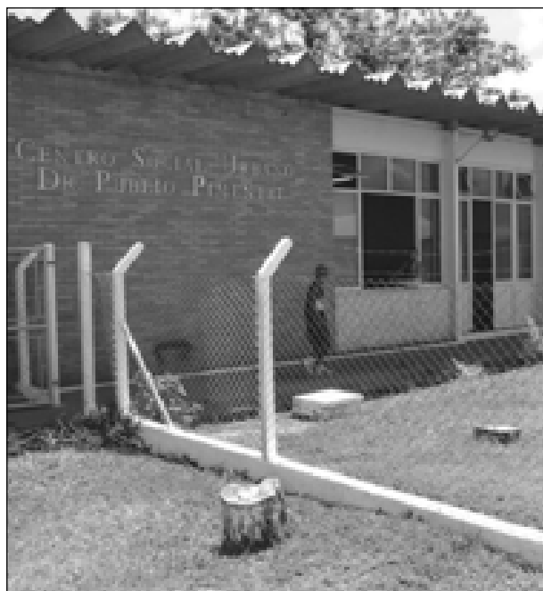
Palestra será na sede do CSU

A palestra acontece no dia 28 de novembro, às 14 horas, no CSU.