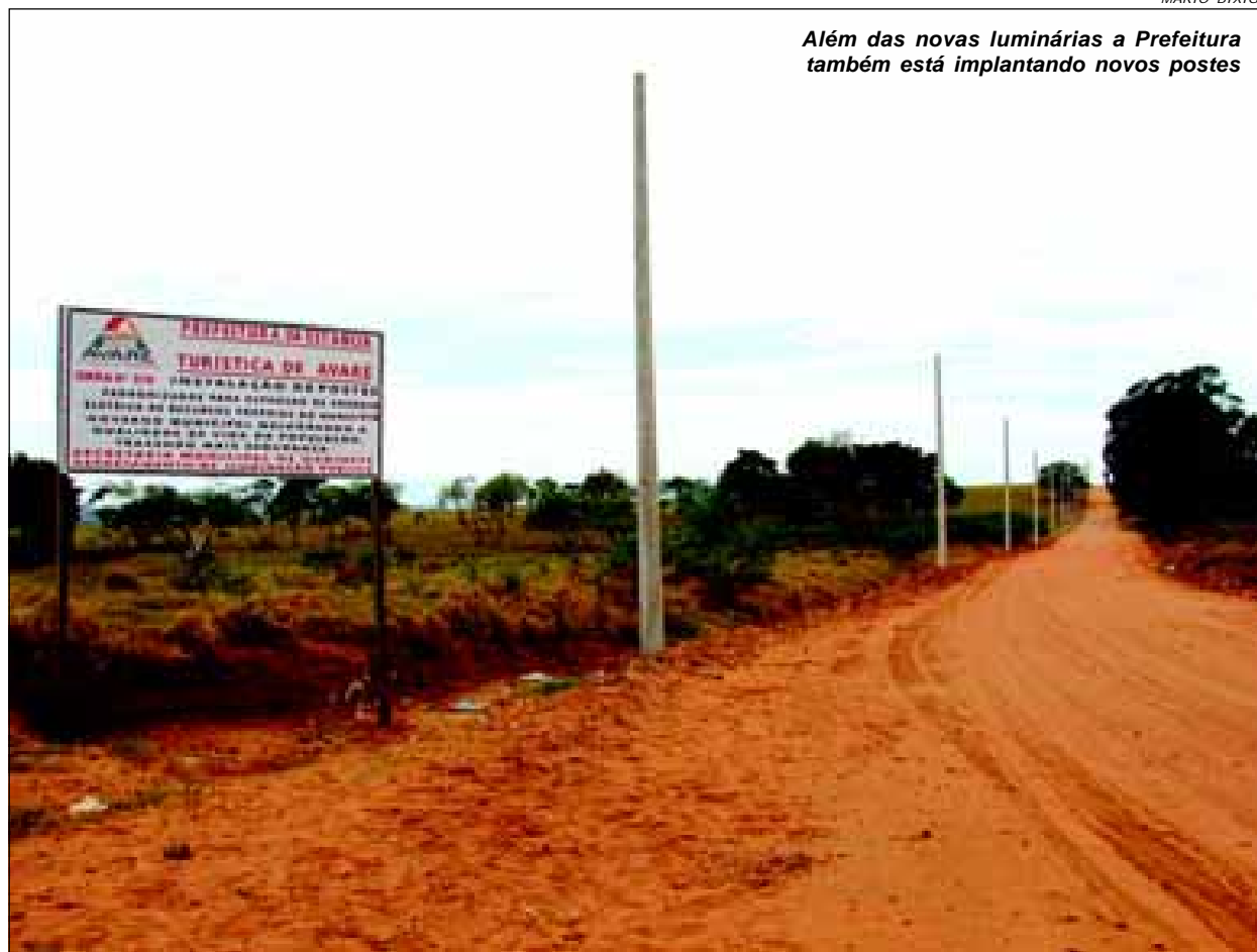
Além das novas luminárias a Prefeitura também está implantando novos postes

Estão sendo colocados 283 postes nos locais mais críticos da cidade, que somados chegam a mais de 60 pontos. O principal ponto, onde havia uma reivindicação antiga da população, é a interligação entre os bairros Ipiranga e Vera Cruz. Neste trecho estão sendo colocados 36 postes. Outro ponto importante é a interligação entre os bairros Vila Jardim e Vila Martins, que está recebendo 32 postes. Nesses e vários outros locais estão inicialmente sendo instalados os postes, posteriormente a Prefeitura