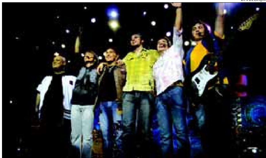
Tradição fará o show de abertura no dia 1º de dezembro

No domingo, dia 2, o show ficará por conta dos irmãos mineiros Victor & Leo. A dupla vem fazendo sucesso em todo o país, principalmente após o lançamento do último CD "Victor & Léo Ao Vivo", que já no primeiro mês de lançamento estava entre os 10 mais vendidos do Brasil.