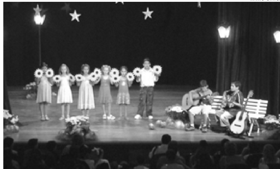
Participaram alunos da rede municipal