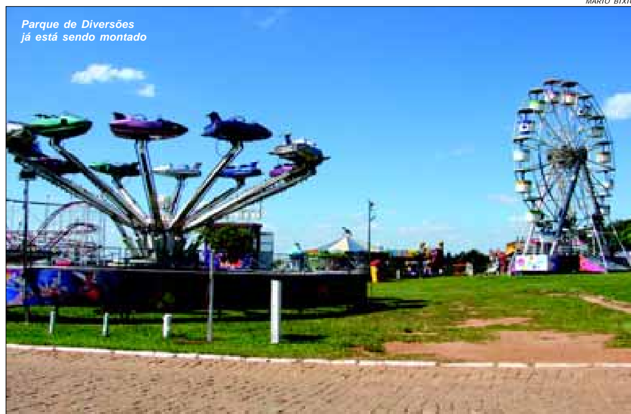
Parque de Diversões já está sendo montado