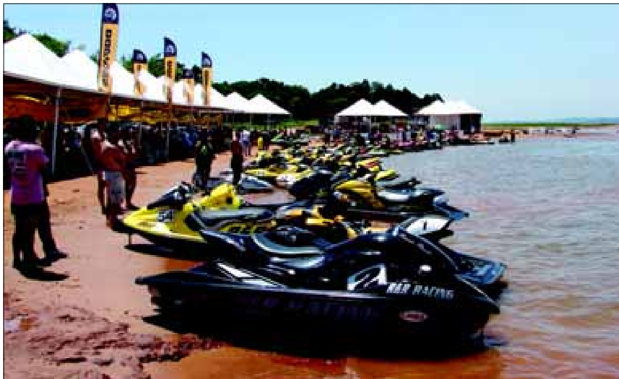
Mais de 60 pilotos participaram do evento

Um bom público compareceu no último fim de semana, dias 17 e 18 de novembro,