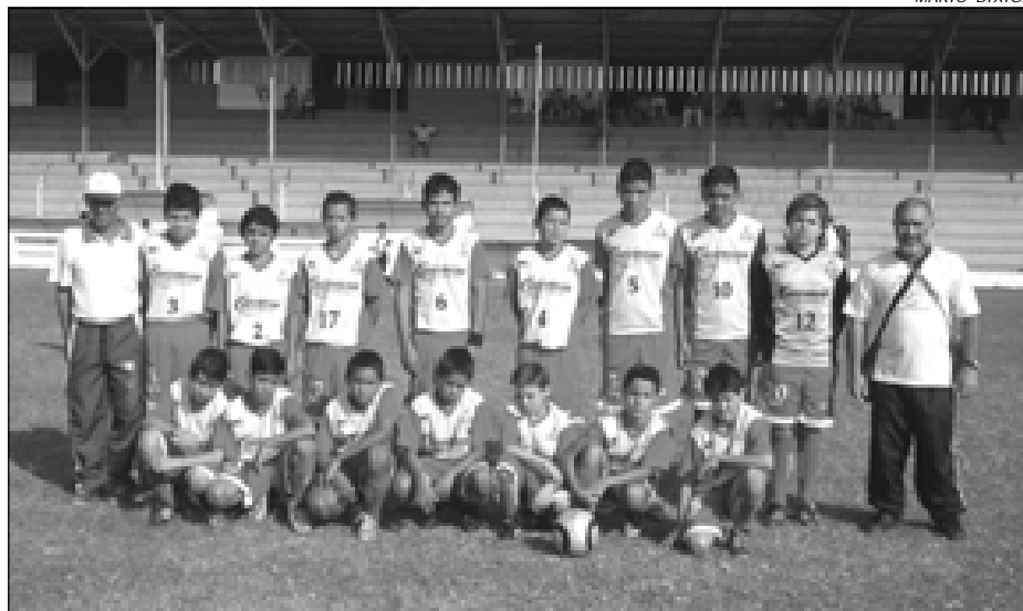
Time Dentinho da SEME