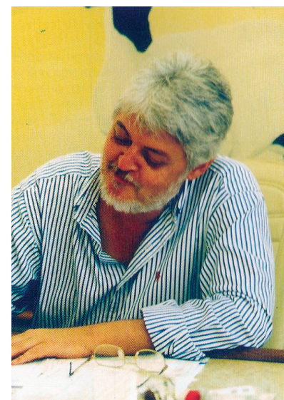
O hoteleiro, 2002.