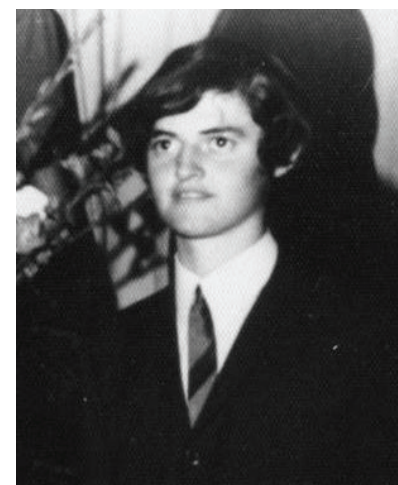
O jovem compositor, 1969.

Condecorado em 2003 com a Medalha do Mérito Legislativo “Maneco Dionísio”, o empresário também foi agraciado com o título de “Cidadão Benemérito”, honraria que não chegou a receber. Acometido de males decorrentes de diabetes, ele faleceu prematuramente no dia 13 de outubro de 2007, em meio a ideias e projetos arquitetados pela sua inteligência fascinada pela causa avareense.