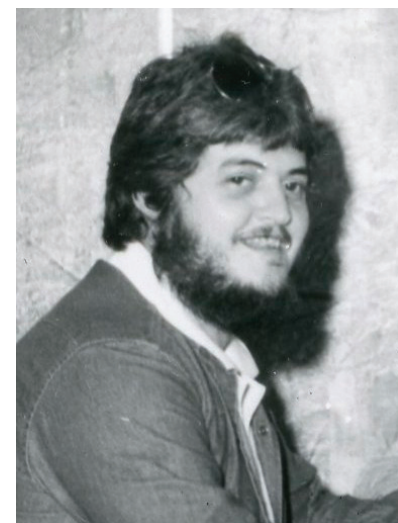
O empreendedor, 1986.