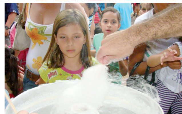
Doces foram distribuídos às crianças

brinquedos como pular-pula, além de ganharem bolas distribuídas. A festa é a uma realização da Secretaria Municipal da Educação, em parceria com a Secretaria da Cultura.