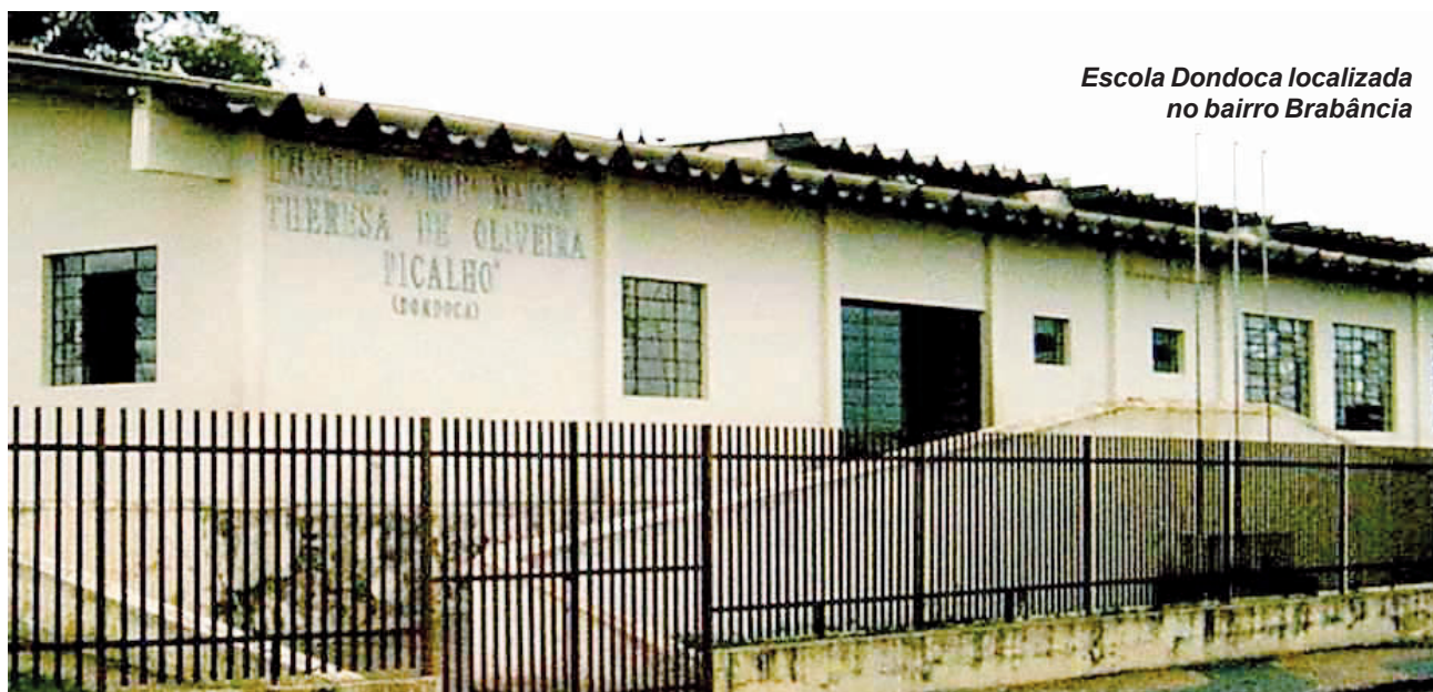
Escola Dondoca localizada no bairro Brabância

No ensino municipal, o bairro conta com a EMEB “Profª Maria Theresa de Oliveira Picalho”, cuja quadra ganhará cobertura para melhor prática esportiva dos alunos e as salas estão sendo ampliadas para abrigar maior número de alunos; no ano passado a escola passou a contar com uma Sala de Recursos Multifuncionais para atender aos alunos com algum tipo de deficiência, e o Centro de Educação Infantil – “CEI Adalgiza Ward”, que está sendo reformada e ampliada, para acomodar maior número de crianças.