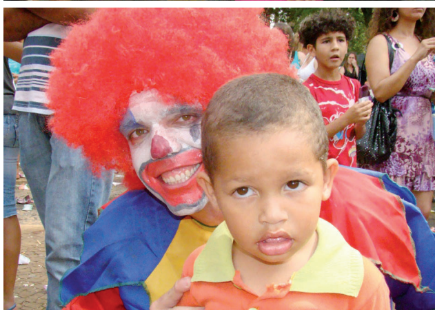
Pessoas vestidas de personagens infantis alegraram as crianças