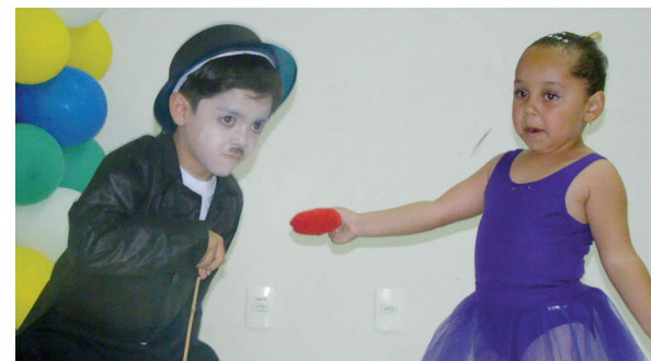
Uma das encenações apresentadas pelos alunos