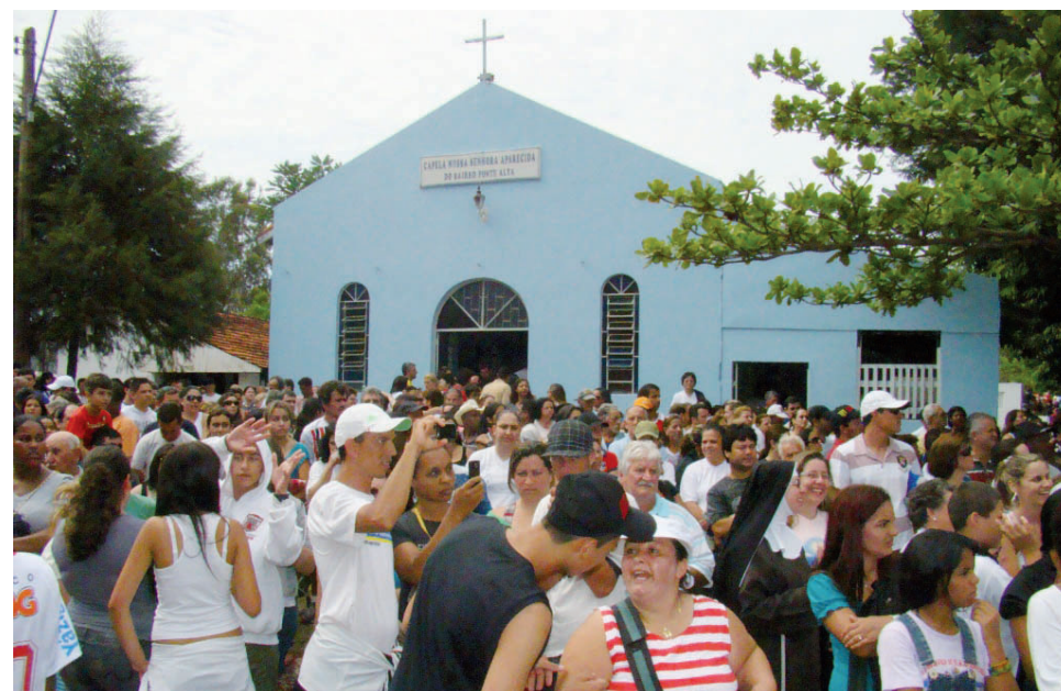
Capela de Nossa Senhora Aparecida na Ponte Alta

No local, as crianças se divertiram ainda com