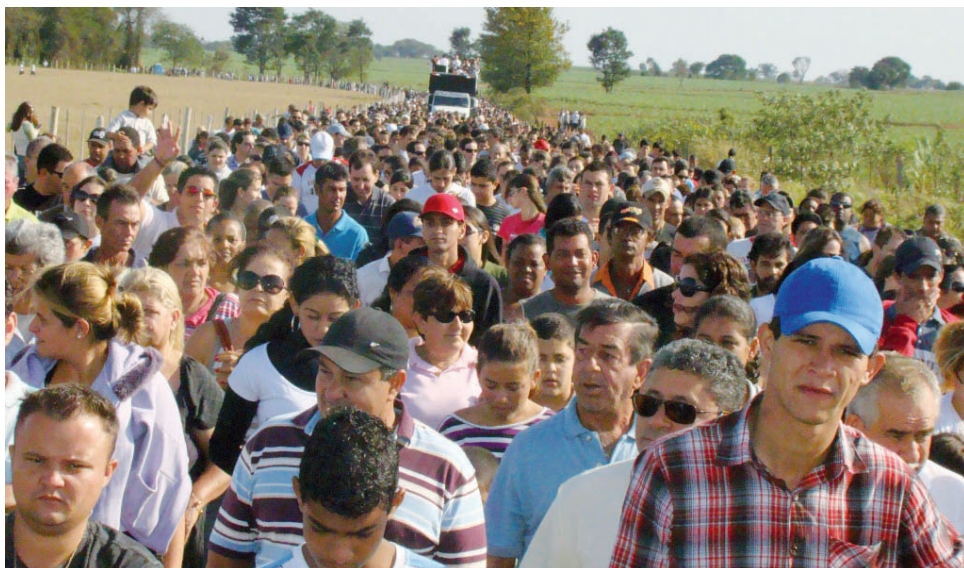
Milhares de fiéis participam da procissão

Com a participação de mais de 20 mil fiéis, superando o número do ano passado, aconteceu no dia 12 de outubro, fe-