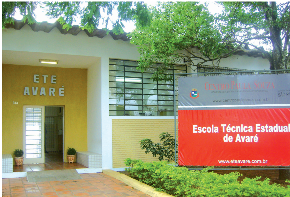
Fachada da ETEC