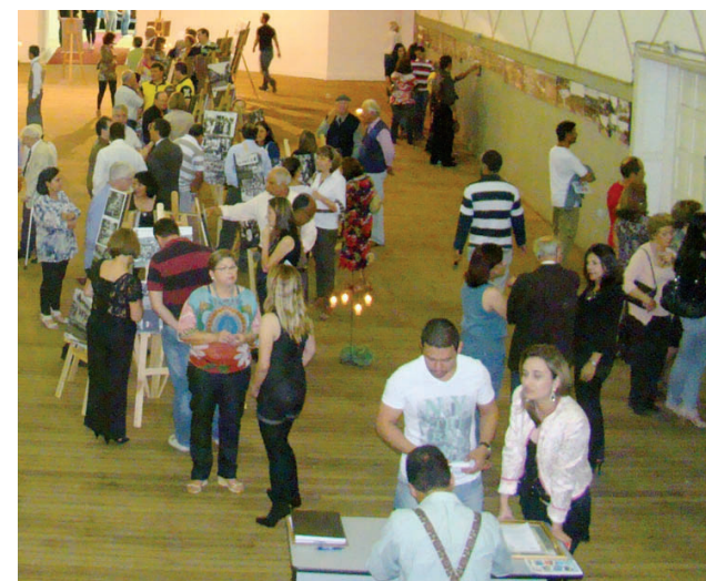
Funcionários da Secretaria da Cultura caracterizados com roupas do passado e população confere as exposições fotográficas

O CONDEPHAC - Conselho de Defesa do Patrimônio Histórico Artístico Cultural de Avaré - em parceria com a Secretaria Municipal de Cultura e Lazer abriu oficialmente no sábado, 8, no Palácio das Artes - Cine Santa Cruz -, a Exposi-